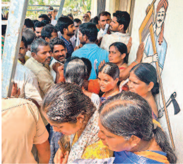
రంగారెడ్డి జిల్లా చేపట్టే మండలం కందవాడ గ్రామంలోని రైతు వేదికలో విత్తనాల కోసం క్యూలో ఉన్న రైతులు