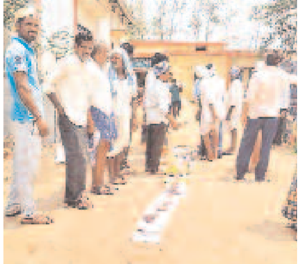
కామారెడ్డి జిల్లా రాజంపేట మండలం అద్దోడ సాస్టెట్ వద్ద జీలుగ విత్తనాల కోసం కాగితాలను క్యూలో ఉంచి నిల్పువ్వ రైతులు