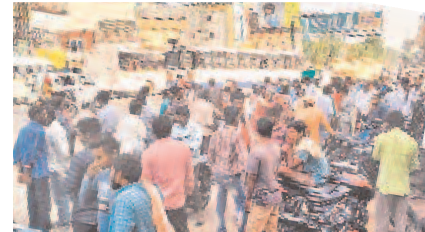
హైదరాబాద్ గండ్లపేసమ్మ చౌరస్తాలో కూలి పనులకోసం ఎదురుమాస్తున్న రైతులు

• సర్కారు వారి పాట.. అమ్మకానికి భూములు! • నిధుల సమీకరణపై సర్కారు కసరత్తు • బుద్వేల్ లోని 75 ఎకరాలకు లారాన్! • రూ. 4వేల కోట్ల సమీకరణ లక్ష్యం • దశల వారీగా మలిగి భూములకు స్కెచ్