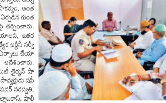
సమావేశంలో పాల్గొన్న ఆయా శాఖల అధికారులు