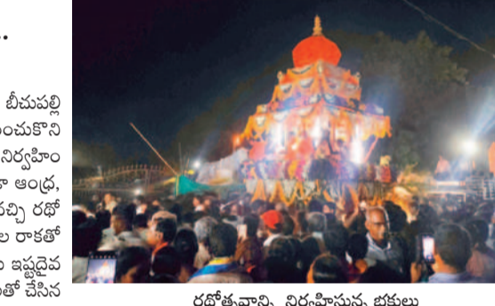
రథోత్సవాన్ని నిర్వహిస్తున్న భక్తులు

ఇటీవల, మే 24 : నడిగడ్డ ఇంటి వద్ద భక్తిశ్రద్ధలతో రథోత్సవం నిర్వహించారు. భక్తులు మొక్కులు తీర్చుకున్నట్లు భక్తులు.. కిక్కిరిసిపోతున్న భక్తులు.. ఇటీవల, మే 24 : నడిగడ్డ ఇంటి వద్ద భక్తిశ్రద్ధలతో రథోత్సవం నిర్వహించారు. భక్తులు మొక్కులు తీర్చుకున్నట్లు భక్తులు.. కిక్కిరిసిపోతున్న భక్తులు.. ఇటీవల, మే 24 : నడిగడ్డ ఇంటి వద్ద భక్తిశ్రద్ధలతో రథోత్సవం నిర్వహించారు. భక్తులు మొక్కులు తీర్చుకున్నట్లు భక్తులు.. కిక్కిరిసిపోతున్న భక్తులు..