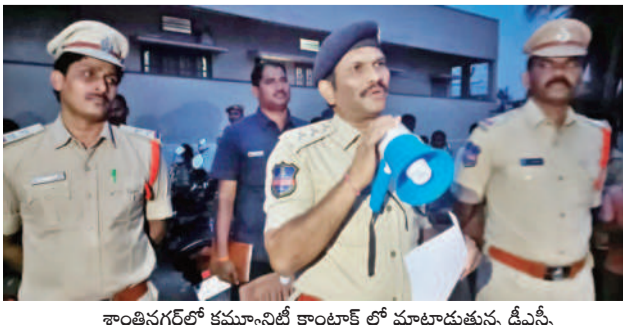
శాంతినిగరిలో కమ్యూనిటీ కాంటాక్ట్ లో మాట్లాడుతున్న డిఎస్సీ