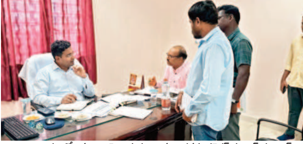
అధికారంలోకి వచ్చిన రాజుల తలుపులకు అదనపు కలెక్టర్ సంచిత గంగాధర్

వనపర్తి, మే 24: మున్సిపాలిటీలోని ప్రతి వార్డులో తమ దృష్టికి వచ్చిన సమస్యలను వెంటనే పరిష్కరించాలని అదనపు కలెక్టర్ సంచిత గంగాధర్ అధికారులకు సూచించారు. శుక్రవారం వనపర్తి మున్సిపాలిటీని ఆన్ లైన్ కంట్రోలు చేయడంపై పూర్వదర్శితో కలిసి మున్సిపాలిటీ పనితీరుపై సమీక్ష నిర్వహించారు.