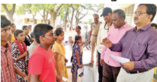
పరీక్ష చోటి వద్ద విద్యార్థులను పరిశీలిస్తున్న సిబ్బంది

వనపర్తి టౌన్, మే 24: వనపర్తి జిల్లా వ్యాప్తంగా నిర్వహించిన పాలిటిక్స్ కి అర్హత పరీక్ష ప్రశాంతంగా ముగిసింది. జిల్లా వ్యాప్తంగా 10 కేంద్రాల్లో 2,394 మంది కిగానూ 2,227 మంది విద్యార్థులు హాజరై 187 మంది విద్యార్థులు గ్రెజుషన్ ర్యాంకులను సాధించారు. జిల్లావ్యాప్తంగా 93.02 శాతం పాఠశాలలోని ఆయన చెప్పారు. అందులో 1,263 మంది బాలబాలికా గానూ 1,182 మంది హాజరు కాగా 81 మంది గ్రెజుషన్ ర్యాంకులు, బాలికలను 1,131 మంది విద్యార్థులకుగానూ 1,045 మందికి గానూ 86 మంది గ్రెజుషన్ గా మొత్తం 167 మంది గ్రెజుషన్లు చెప్పారు. కార్యక్రమం