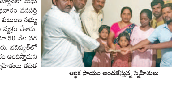
ఆర్థిక సాయం అందజేస్తున్న స్నేహితులు