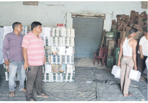
నిర్మల్ జిల్లాకు చేరిన పాఠ్యపుస్తకాలు

నిర్మల్ అర్బన్, మే 24 : నిర్మల్ జిల్లాలోని 836 ప్రభుత్వ పాఠశాలలకు సరఫరా చేసే ఉచిత పాఠ్యపుస్తకాలు 81 శాతం జిల్లాకు చేరుకున్నాయని డిఈవో డాక్టర్ రవీందర్ రెడ్డి తెలిపారు. నిర్మల్ జిల్లాకు పార్ట్ వన్ లో భాగంగా మొత్తం 8,61,776 పాఠ్యపుస్తకాలు రావాల్సి ఉండగా 2,93,482 పాఠ్యపుస్తకాలు వచ్చాయని త్వరలో పూర్తి స్థాయిలో రానున్నాయని పేర్కొన్నారు. బడులు ప్రారంభమయ్యేలోగా వీటిని పాఠశాలలకు పంపిణీ చేస్తామని తెలిపారు.