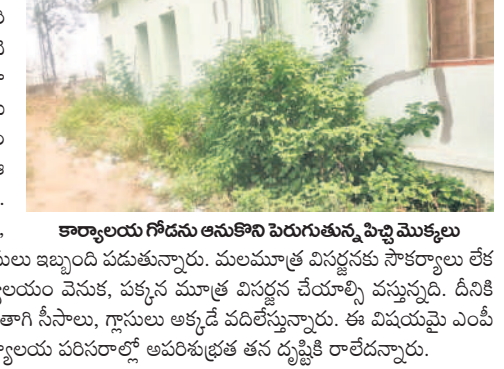
కార్యాలయ గోడను అనుసరించి పనులు చేస్తున్న పిచ్చి మొక్కలు