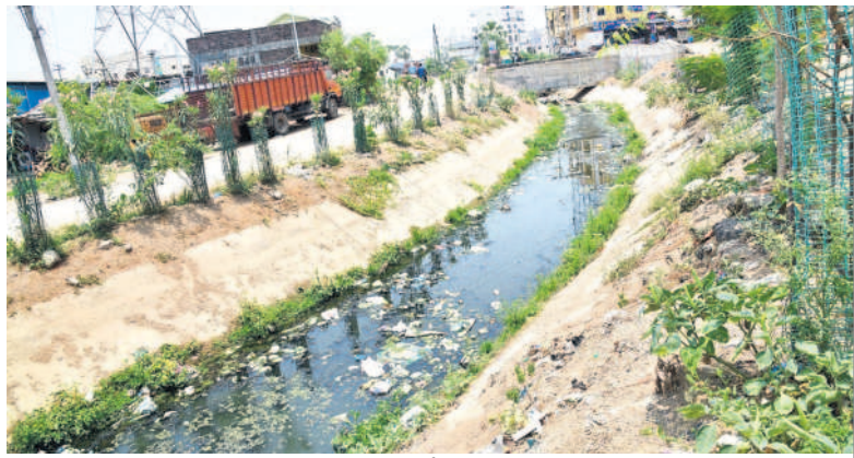
రేతుల్లోని ఎస్సారెస్సీ కాలువ