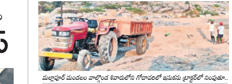
మల్లాపూర్ మండలం వాల్మీకి శివారులోని గోదావరిలో ఇసుకను ప్రాక్టర్లో నింపుతూ..