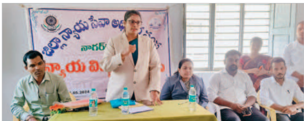
సమావేశంలో మాట్లాడుతున్న జడ్పీ సభిత