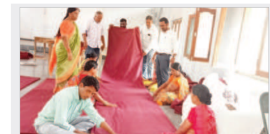
స్కూల్ యూనిఫాంలను సిద్ధం చేస్తున్న బకేటీ సిబ్బంది