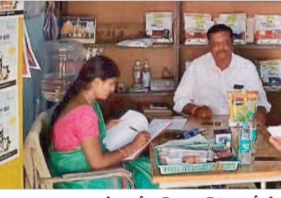
బీజేపీవల్లొత్ సైట్ రిజిస్ట్రేషన్ తనిఖీ చేస్తున్న అధికారులు