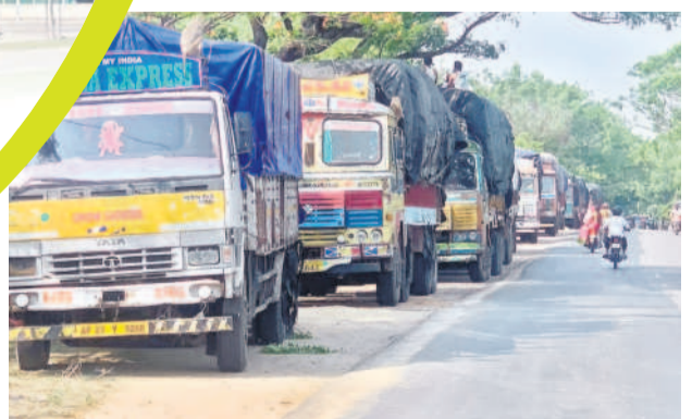
జోన్నల లోడ్తో రుదూర్ వచ్చిన నిలిచిన లారీలు

తండాలుకు చెందిన వారు గొడవలకు దిగారు. అటవీ భూముల కోసం రెండు తండాలుకు చెందిన వారు గొడవలు చదుతున్నప్పటికీ అటవీ శాఖ అధికారులకు ఏమీ తెలియనట్లు ఉంటున్నారనే విషయం వస్తున్నాయి. గాంధారి మండలంలోని చద్దల్ తండా, నాగార్ తండా, నేర లేతండా, బీర్పల్ తండా, కొత్తబాది తండా, సోమారం తండా, గండివేటి, సీతాయిపల్లి, పేట్ సంగం, పాతంగల్ కలాసి, కాటేవాడి, కర్లం గడ్డ తండాల్లో వేరొంది ఎకరాల అటవీ భూములు ఆక్రమణకు గురయ్యాయి.