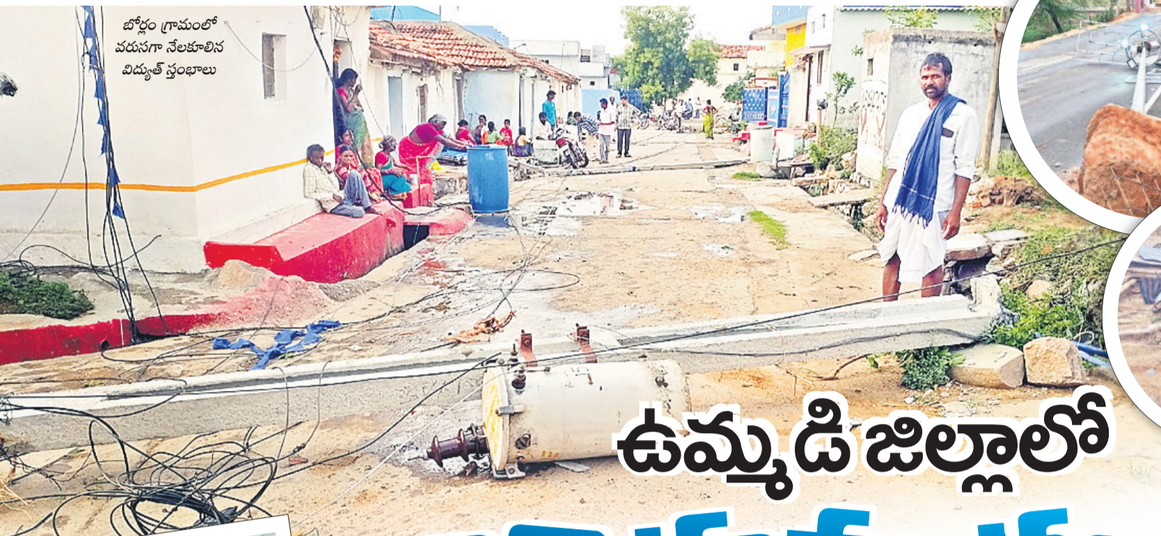
బోర్లం గ్రామంలో వరుసగా నేలకూలిన విద్యుత్ స్తంభాలు