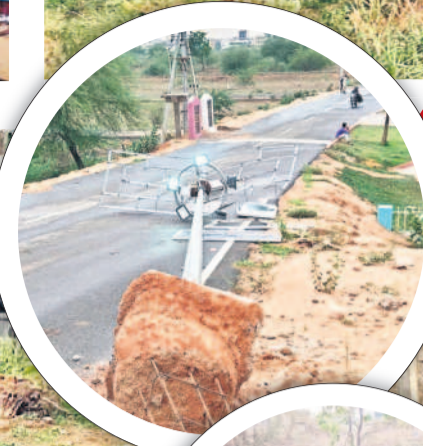
బాన్సువాడ మండలం బోర్లం నేలకూలిన విద్యుత్ స్తంభాలు