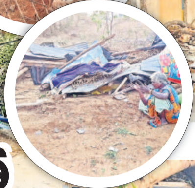
బోర్లంలో ఇంటి పైకప్పు ఎగిరిపోయి పూర్తిగా నేలమట్టమైన ఇల్లు