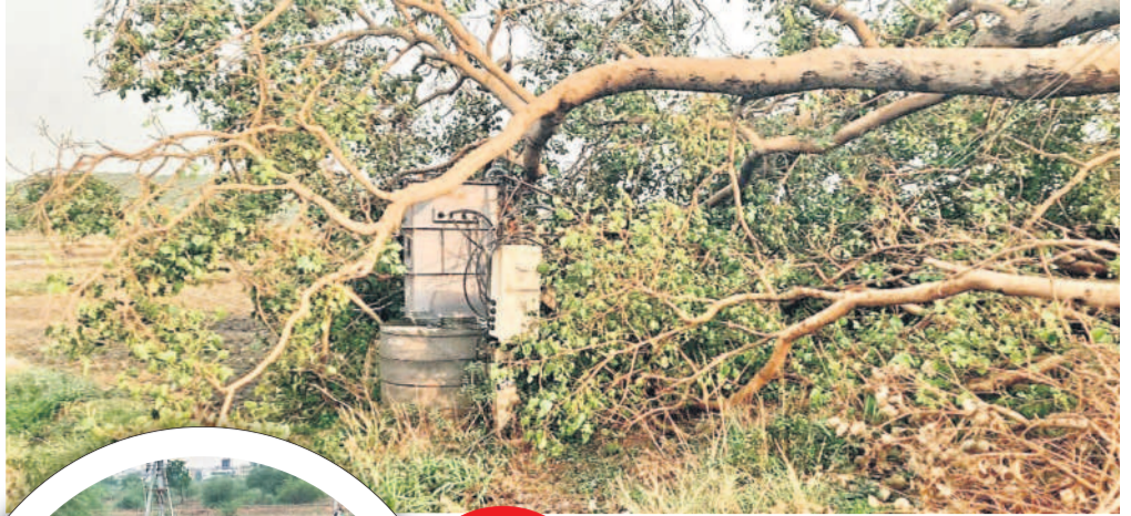
అంబం రోడ్లో ట్రాన్స్ఫార్మర్ పడిన చెట్టు