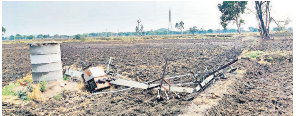
కొటిగిరి మండలం రాంపూర్లో ఈదురుగాలులకు నేలకొరిగిన ట్రాన్స్ఫార్మర్