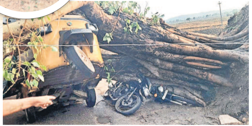
అంబంలో ఆటో, ద్విచక్రవాహనాలపై కూలిన భారీ వృక్షం