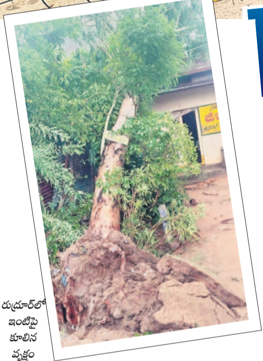
రుదూర్లో ఇంటిపై కూలిన వృక్షం