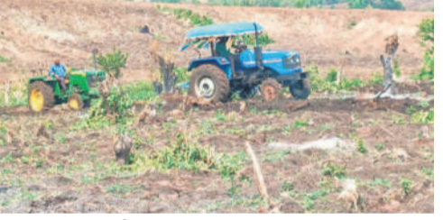
కొత్తబాది సహాయంతో అటవీ భూమిని దున్నుతున్న తండావాసులు

గాంధారి, మే 28: అటవీ భూముల కోసం రెండు తండాలుకు చెందిన వారు గొడవలకు దిగిన సంఘటన కామారెడ్డి జిల్లా గాంధారి మండలంలో ఆదివారం చోటు చేసుకున్నది. గాంధారి మండలం కొత్తబాది తండా, సోమారం తండాలుకు చెందిన పలువురు రైతులు పోడుపట్టాలను పొందారు. ఈ పట్టాలను అడ్డం పెట్టుకొని చాలా మంది యధేచ్ఛగా అటవీ భూములను ఆక్రమిస్తున్నారు. భూములను ఆక్రమించే క్రమంలో ఒకరి తండా శివారులోకి మరొకరు వెళ్ళడం గొడవలకు దారితీసింది. కొత్తబాది, సోమారం తండాల్లో చాలా మంది 5 నుంచి 10 ఎకరాల వరకు పోడు పట్టాలను పొందారు. దీంతో ఆగకుండా కొత్తగా అటవీ భూముల్లోని చెట్లను సరికివేస్తూ ఆక్రమిస్తున్నారు. ఆ భూములు తమవి అంటే తమవని రెండు