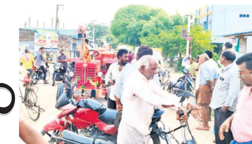
ఇసుక ట్రాక్టర్లను అడ్డుకుంటున్న గ్రామస్థులు (ఫైల్)