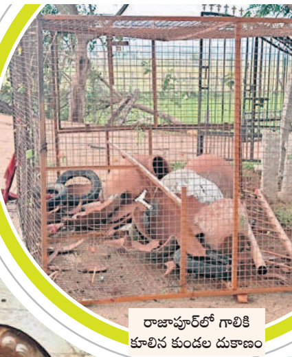
రాజాపూర్లో గాలికి కూలిన కుండల దుకాణం