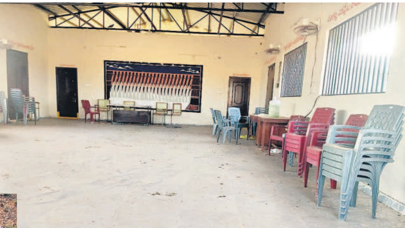
లోపలి భాగం అవసరంకాక ఉన్న నాగర్ కర్నూల్ జిల్లా చందాయపల్లి రైతువేదిక

మారాయి. క్షేత్ర గ్రామాల్లో ఏర్పాటు చేసిన ఈ వేదిక లు దివ్యబోమ్మలను తలపిస్తున్నాయి. చాలా వేదికలను తెరిచేందుకు ఏకావోలు ముందుకు రావడం లేదన్న ఆ రోపణలు వినిపిస్తున్నాయి. గ్రామ శివార్లలో ఉన్న రైతు వేదికల అసాధికార కార్యకలాపాలకు అడ్డాగా మారాయి. బీఆర్ఎస్ పాలనలో ఏకావోలు తప్పనిసరిగా రైతు వేది కల ద్వారానే రైతులకు అందుబాటులో ఉంటూ వచ్చారు. కాగా ప్రభుత్వం మారాక వ్యవసాయ శాఖ, ఏకా వోలు పట్టించుకోవడం మానేశారు. చాలా వేదికలు తా శాలు కూడా తీరుకు దుమ్ము, ధూళితో నిండిపో