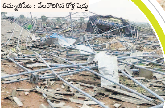
తిమ్మాజిపేట : నేలకొరిగిన కోళ్ల పెద్ద