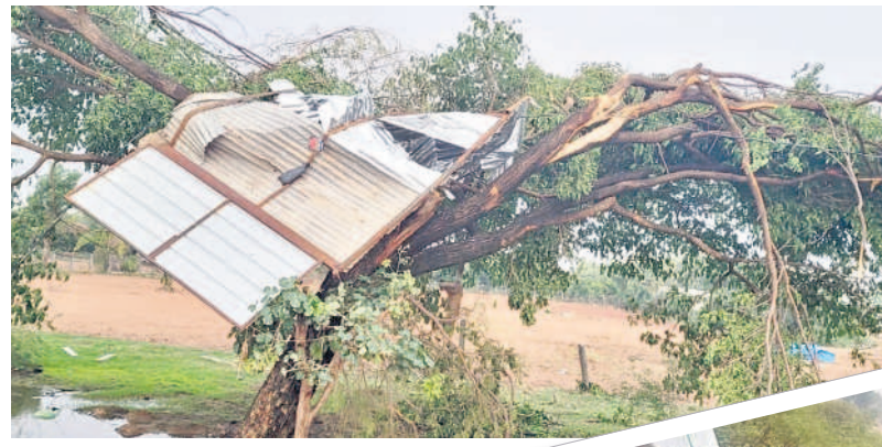
సవాబ్పేట : ఇప్పటికీ గాలికి ఎగిరిపోయి చెట్టుపై పడిన హోటల్ పై కప్పు