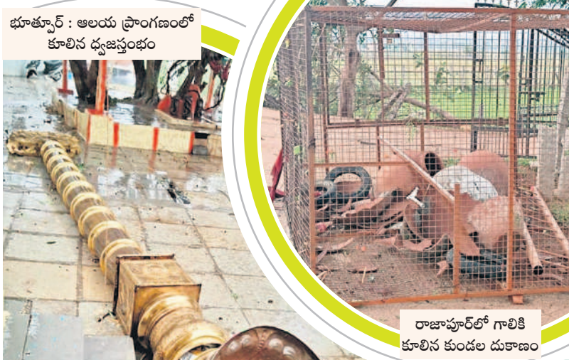
భూత్పూర్ : ఆలయ ప్రాంగణంలో కూలిన ధ్వజస్తంభం