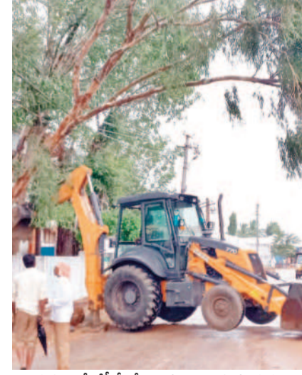
దుప్పర్తిలో జేసీబీతో చెట్లను తొలగిస్తున్న దృశ్యం