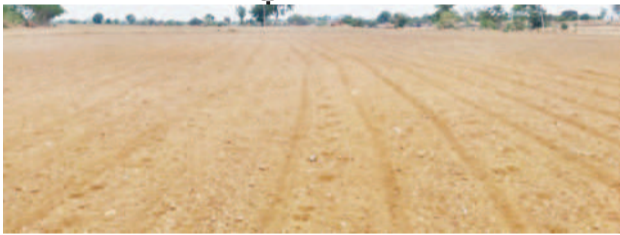
దమాజీపల్లిలో దుక్కలు సిద్ధం చేసిన ద్యశం

పానగల్, మే 25 : ఈవిధాది మోస్తరుగా వర్షాలు కురుస్తుండడంతో రైతులు ఉత్సాహంగా వానకాలం సాగుకు సిద్ధమవుతున్నారు. మండలంలో ప్రధానంగా సాగు చేసే జొన్న, మొక్కజొన్న, కందులు, సెసర్లు తదితర అరుతడి పంటలకోసం రైతులు ముమ్మంగా వేసవి దుక్కలు సిద్ధం చేస్తున్నారు. భూమి దున్నడానికి అ