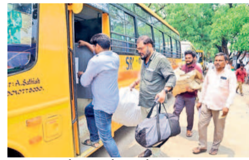
ములుగులో సామగ్రితో బస్సులో బయల్దేరుతున్న సిబ్బంది