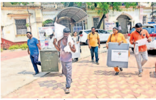
వరంగల్లో సామగ్రితో పోలింగ్ సింబల్ కు వెళ్తున్న సిబ్బంది