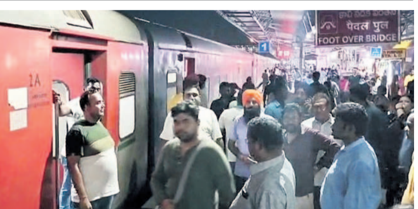
వరంగల్ రైల్వేస్టేషన్లో ఏపీ ఎక్స్ ప్రెస్ రైలు నుంచి షాట్ ప్యాంప్లెట్ వచ్చిన ప్రయాణికులు