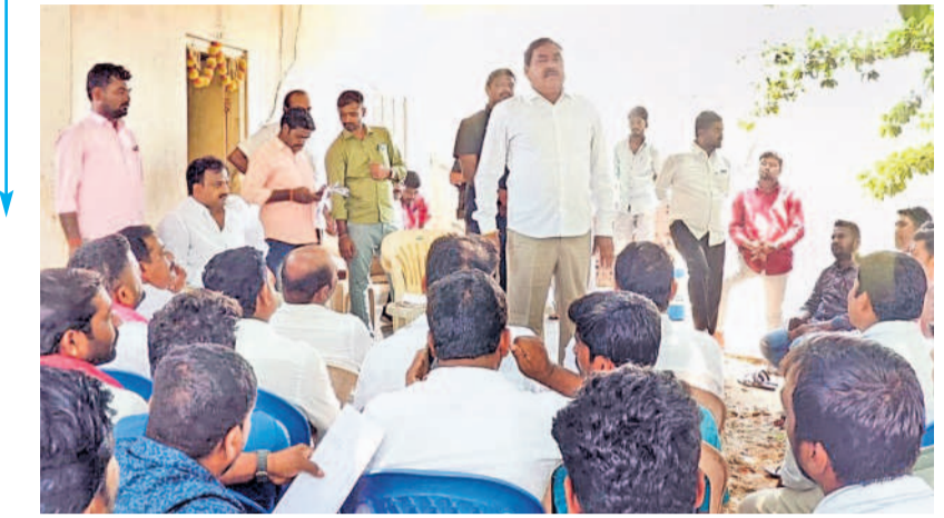
దేవరపల్లిలో మాట్లాడుతున్న మాజీ మంత్రి దయాకర్ రావు