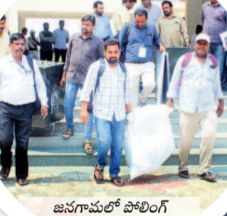
జనగామలో పోలింగ్ సామగ్రిని తీసుకెళ్తున్న సిబ్బంది

గ్రాడ్యుయేట్ ఉప ఎన్నిక ప్రచార సరళి గతంలో ఎప్పుడూ లేనంత ఉత్సాహం కనిపించింది. అసెంబ్లీ, ఆ తర్వాత లోక్ సభ ఎన్నికలు ముగిసిన వెంటనే ఈ ఎన్నిక జరుగనుండడం... ప్రధాన రాజకీయ పార్టీలకు ప్రతిష్టాత్మకంగా మారింది. ఎమ్మెల్యే నియోజకవర్గ పరిధిలో 12 జిల్లాలు, 34 అసెంబ్లీ నియోజకవర్గాలు ఉన్నాయి. 2023 నవంబర్