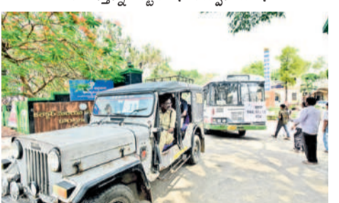
వరంగల్ కలెక్టరేట్ నుంచి పోలింగ్ బండ్లను మద్య పోలింగ్ సామగ్రిని తరలిస్తున్న అధికారులు

వరంగల్, మే 26(నమస్తే తెలంగాణ ప్రతినిధి) : వరంగల్-ఖమ్మం-నల్లగొండ ఉమ్మడి జిల్లా పట్టణంల నియోజకవర్గ ఎమ్మెల్యే ఉప ఎన్నికకు సర్వం సిద్ధమైంది. సోమవారం ఉదయం 8 గంటల నుంచి సాయంత్రం నాలుగు గంటల వరకు పోలింగ్ జరగనున్నది. ఎమ్మెల్యే నియోజక వర్గ పరిధిలో 12 జిల్లాలు ఉండగా జిల్లాకో డిస్ట్రిబ్యూటర్ల సింబల్ ఏర్పాటు చేశారు. ఆదివారం సాయంత్రం పోలింగ్ సిబ్బంది తమకు కేటాయించిన సామగ్రితో కేంద్రాలకు బయల్దేరారు.