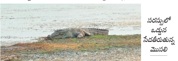
సరస్సులో ఒడ్డున సేద తీరుతున్న మొసలి

ఖానాపూర్, మే 26: పాకాల సరస్సు ఒడ్డున భారీ మొసలి ఆదివారం సేద తీరుతూ పర్యాటకులకు కనిపించింది. సరస్సులో నీరు అడుగుంటలతో మధ్యాహ్నం సమయంలో మొసలి ఒడ్డుకు వస్తున్నాయి. మనషుల అతిడితో వెంటనే సరస్సులోకి జారుకుంటున్నాయి. పర్యాటకులు సరస్సులోకి దిగి మొసలికి బారిన పడొద్దని అటవీ శాఖ అధికారులు హెచ్చరిస్తున్నారు.