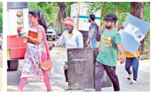
హనుమాంకోండలో సామగ్రితో పోలింగ్ సింబల్ కు వెళ్తున్న సిబ్బంది