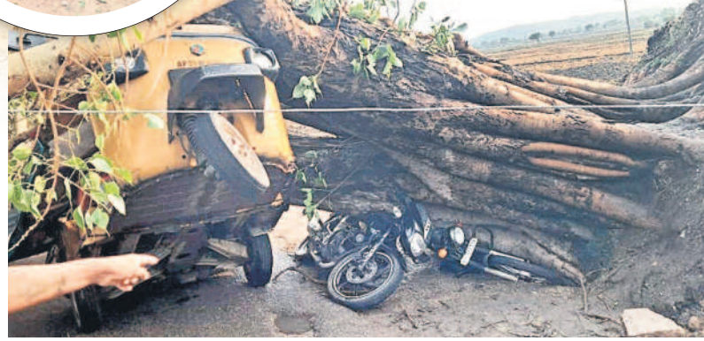
అంబంలో ఆటో, ద్విచక్రవాహనాలపై కూలిన భారీ వృక్షం