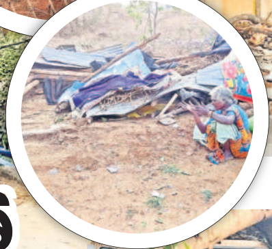
బోర్లంలో ఇంటి పైకప్పు విగిపోయి పూర్తిగా నేలమట్టమైన ఇల్లు