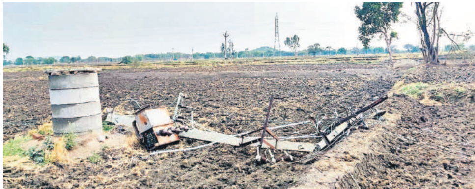
కొటగిరి మండలం రాంపూర్లో ఈదురుగాలులకు నేలకొరిగిన ట్రాన్స్ఫార్మర్