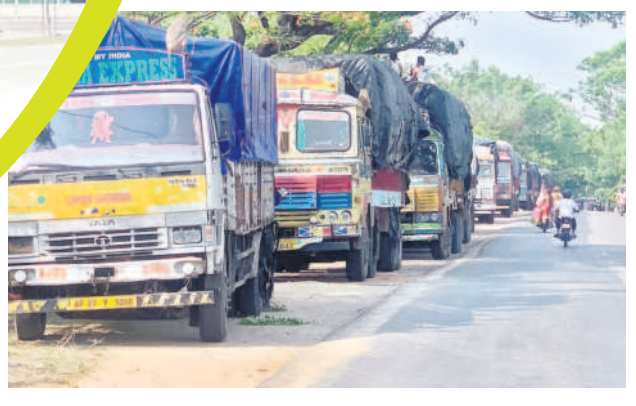
జోన్నల లోడ్తో రుదూర్ వచ్చిన నిలిచిన లారీలు

తండాలు చెందిన వారు గొడవలకు దిగారు. అటవీ భూముల కోసం రెండు తండాలు చెందిన వారు గొడవలు చదుతున్నప్పటికీ అటవీ శాఖ అధికారులకు ఏమీ తెలియట్లు ఉంటున్నారనే విషయం పన్ను న్నాయి. గాంధారి మండలంలోని చద్దల్ తండా, నాగార్ తండా, నేర లీ తండా, బీర్ల తండా, కొత్తబాది తండా, సోమారం తండా, గండి వేట్, సీతాయిపల్లి, పేట్ సంగం, పాతంగల్ కలాసి, కాటేవాడి, కర్లం గడ్డ తండాల్లో వేలాది ఎకరాల అటవీ భూములు ఆక్రమణకు గురయ్యాయి.