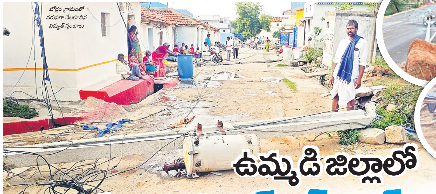
బోర్లం గ్రామంలో వరుసగా నేలకూలిన విద్యుత్ స్తంభాలు