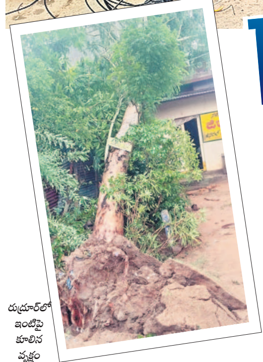
రుదూర్లో ఇంటిపై కూలిన వృక్షం