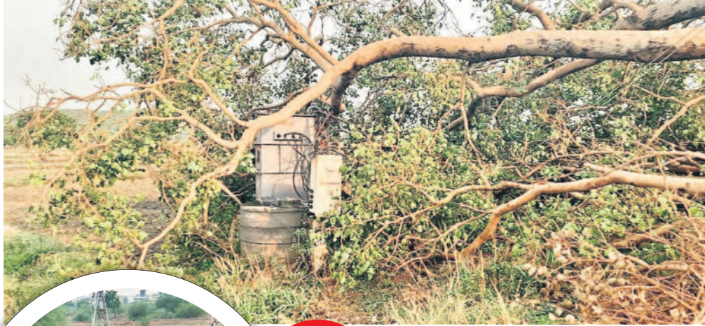
అంబం రోడ్లో ట్రాన్స్ఫార్మర్ పడిన చెట్టు