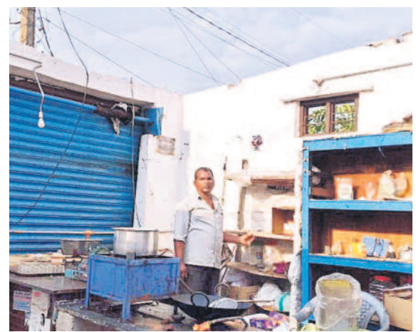
బోర్లంలో గాలికి విగిపోయిన హోటల్ పైకప్పు