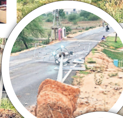
బాన్సువాడ మీదే ట్రాంక్ బండ్లపై నేలకూలిన హైమార్కెట్