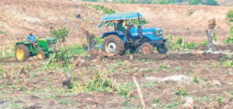
ట్రాక్టర్ సహాయంతో అటవీ భూమిని దున్నుతున్న తండావాసులు

గాంధారి, మే 26: అటవీ భూముల కోసం రెండు తండాలు చెందిన వారు గొడవలకు దిగిన సంఘటన కామారెడ్డి జిల్లా గాంధారి మండలంలో అదివారం చోటు చేసుకున్నది. గాంధారి మండలం కొత్తబాది తండా, సోమారం తండాలు చెందిన పలువురు రైతులు పోడుపట్టణం పొందారు. ఈ పట్టణం అడ్డం పెట్టుకొని చాలా మంది యధేచ్ఛగా అటవీ భూములను ఆక్రమిస్తున్నారు. భూములను ఆక్రమించే క్రమంలో ఒకరి తండా శివారులోకి మరొకరు వెళ్లడం గొడవలకు దారితీసింది. కొత్తబాది, సోమారం తండాల్లో చాలా మంది 5 నుంచి 10 ఎకరాల వరకు పోడు పట్టణం పొందారు. దీంతో ఆగకుండా కొత్తబాది అటవీ భూముల్లోని చెట్లను నరికివేస్తూ ఆక్రమిస్తున్నారు. ఆ భూములు తమవి అంటే తమవని రెండు