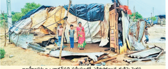
ఇబ్రహీంపట్నం : నాగంపల్లి సమీపంలో ఎగిరిపోయిన గుడిసె ప్రకృతి

ధారూరు : ధారూరు మండల పరిధిలోని నాగారం, ధారూరు, మైలారం, కుమ్మరిపల్లి, గురుదొడ్డి, దోర్నాల్, అల్లిపూర్, తగిలిపల్ల, రాజాపూర్, మోమిన్ ఖుర్షు, గడ్డేపల్లి, అవుసుపల్లి, చింతకుంట, అంతారం తదితర గ్రామాల్లో వాన దంచికొట్టింది. నాగారం గ్రామంలో చెట్లు విరిగి గోడలు, రోడ్లపై పడ్డాయి. విద్యుత్ సరఫరాకు అంతరాయం ఏర్పడింది. గ్రామంలో బ్రాన్స్ పార్కు కింద పడిపోయింది. మైలారం గ్రామంలోని ప్రాథమిక పాఠశాల వరకు విద్యుత్ సరఫరాను నిలిపివేశారు. ముందలితండాలో రేకులు ఎగిరిపోయాయి. అల్లిపూర్ గ్రామ సమీపంలో చెట్లు విరిగి రోడ్లకు అడ్డంగా పడింది. మోమిన్ ఖుర్షు