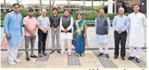
కన్యా శాంతివనాన్ని సందర్శిస్తున్న మధ్యప్రదేశ్ సీఎం మోహన్ యాదవ్

కన్యా సంరక్షించిన మధ్యప్రదేశ్ సీఎం మోహన్ యాదవ్