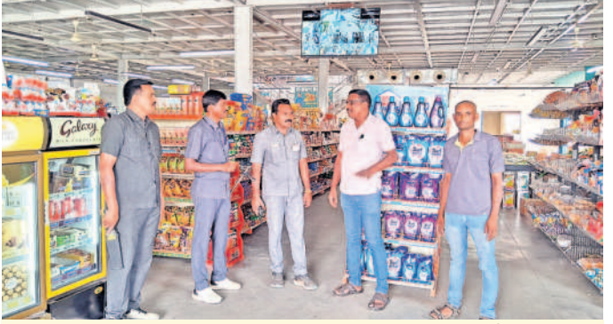
తుర్కయాంజాల్ లోని బీ మార్కెట్ తనిఖీ చేస్తున్న బాంబ్ స్క్వాడ్ పాలీసులు