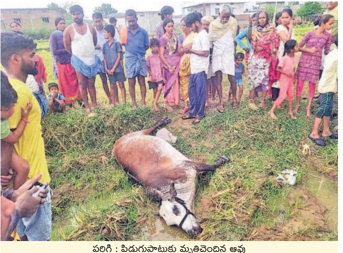
పరిగి : పెడుగుపాటుకు మృతించిన ఆవు