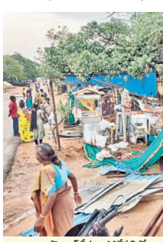
బోరానపేట : పోలేపల్లిలో గాలిలకు చెల్లాచెదురైన రేకుల దుకాణం

బోరానపేట : బోరానపేట, పోలేపల్లి గ్రామాల్లో రహదారులపై చెట్లు విరిగిపడ్డాయి. ఎల్లమ్మ ఆలయం ధ్వంసంకావడం కొద్దిభాగం గాలికి విరిగిపోయింది. ఆలయం సమీపంలో బేగర్ స్టాంపు చెందిన రేకుల దుకాణం చెల్లాచెదురైంది. తుంకిపెట్ల గ్రామంలో ఆడో పేర బేగర్ శివ శివ ఇంటిపై చెట్లు విరిగిపడడంతో ఇంటికి నష్టం వాటిల్లింది. ఇంట్లో ఎవరూ లేక పోవడంతో ప్రమాదం జరుగలేదు. లక్ష రూపా