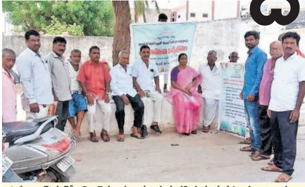
విత్తన కొనుగోలుపై రైతులకు అవగాహన కల్పిస్తున్న వ్యవసాయ అధికారులు

మొయినాబాద్, మే 26 : ఖరీదే వంటల సాగుకు రైతులు సిద్ధమవుతున్నారు. ఇటీవల కురిసిన వర్షాలకు రైతులు దుక్కులు దున్ను పొతం చేస్తున్నారు. విత్తనాలు విత్తేందుకు పెట్టుబడులు కూడా రెడీగా ఉంచుతున్నారు. జూన్ మొదటి వారంలో వైరుతి రుతుపవనాలు వస్తాయని సకాలంలో వర్షాలు కురిసే అవకాశం ఉందని వాతావరణ శాఖ అధికారులు పేర్కొన్నారు. సకాలంలో వర్షాలు కురిస్తే రైతులు పత్తి, మక్కతో పాటు ఇతర విత్తనాలు విత్తడానికి సమాయత్తమవుతున్నారు. చాలా మంది రైతులు ఇప్పటి నుంచే తమకు కావాల్సిన కంటే విత్తనాలను కొనుగోలు చేసేందుకు ఆసక్తి చూపుతున్నారు. దీంతో పలువురు వ్యాపారులు ఆ విత్తనాల లభ్యత తక్కువగా ఉందంటూ ఎక్కువ మొత్తంలో వసూలు చేయడానికి సిద్ధమవుతున్నారు. ఇలాంటి పదతులకు వస్తున్న నేపథ్యంలో అధికారులు ముందుగానే అప్రమత్తమై చేమెట్టిడివిజన్లోని వివిధ ఫైల్డ్రజర్ దుకాణాల్లో తనిఖీలు చేయడం ప్రారంభించారు. ఆయా దుకాణాల్లో విత్తనాల నాణ్యతను పరిశీలిస్తున్నారు. ఎమ్మార్వీకే విత్తనాలు విక్రయించాలని.. ఎక్కువ ధరకు ఎవరైనా విత్తనాన్ని చర్యలు తీసుకుంటామని వ్యవసాయ అధికారులు హెచ్చరిస్తున్నారు. నశిల్లి విత్తనాలు అమ్మితే దుకాణాల లైసెన్స్ ను రద్దు చేస్తామంటున్నారు. అన్నిదశల అమాయకత్వాన్ని ఆసరాగా చేసుకుని విత్తన కంపెనీలకు చెందిన ప్రతినిధులు వ్యాపారులతో కుమ్మక్కై గ్రామాల్లో సందరించే అవకాశం కూడా ఉందని వ్యవసాయ అధికారులు రైతులను అప్రమత్తం చేస్తున్నారు. రైతులు ఏ పూత్రం ఏమరుపాటుగా ఉన్నా పెట్టిన పెట్టుబడి, పంట కాలం వృధా అయ్యే ప్రమాదం ఉన్నది.