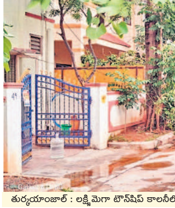
తుర్కయాంజాల్ : లక్ష్మీమిగా టౌన్ షిప్ కాలనీలో కూలిన చెట్లు