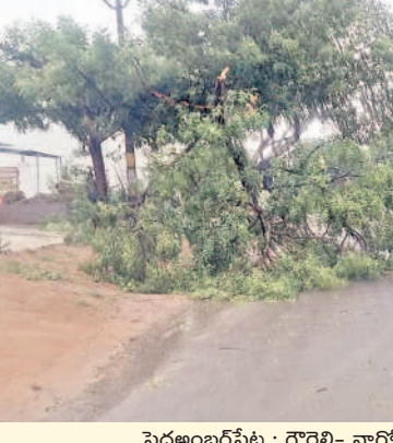
పెద్దఅంబరపేట : గోరెల్లి- నాగోల్ రోడ్డులో కూలిన చెట్లు

రావి నారాయణరెడ్డి కాలనీలోని పలు ఇండ్ల రేకులు ఎగిరిపోయాయి.