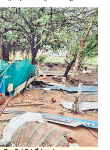
బోరానపేట : పోలేపల్లిలో గాలిలకు చెల్లాచెదురైన రేకుల దుకాణం

పెద్దఅంబరపేట : మున్సిపాలిటీలో పాటు అబ్దుల్లాపూర్ మండల పరిధిలోని గోరెల్లి, తారామతిపేట, కుమ్మర్లపూర్ గ్రామాల్లో ఇంటికి నష్టం వాటిల్లింది. ఇంట్లో ఎవరూ లేక పోవడంతో ప్రమాదం జరుగలేదు. లక్ష రూపా