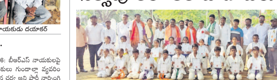
విద్యార్థులకు నర్సిపేట్లో అందజేస్తున్న నాయకులు