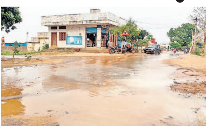
రోడ్డు పై వృధాగా పారుతున్న మంచినీరు