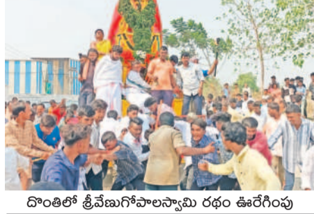
దొంతిలో తీవేణుగోపాలస్వామి రథం ఊరేగింపు