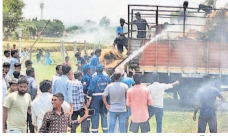
మంటలు ఆర్పుతున్న పైర్ సిబ్బంది