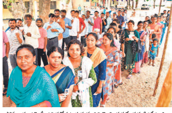
సోమవారం ఎమ్మెల్యే పోలింగ్లో ఓటుహక్కును వినియోగించుకునేందుకు సిద్ధపేట జిల్లా చేర్యాలలోని పోలింగ్ కేంద్రంలో బారులు తీలిన పట్టణీయులు

నల్లగొండ, ఖమ్మం, వరంగల్ ఉమ్మడి జిల్లాల గ్రామీణులకు ఉప ఎన్నిక పోలింగ్ ప్రశాంతం ఓటమి భయంతో డబ్బులు పంచిన కాంగ్రెస్ ఎలాంటి చర్యలూ తీసుకోని అధికారులు జూన్ ఐదోతేదీన నల్లగొండలో ఓట్ల లెక్కింపు హైదరాబాద్, మే 27 (నమస్తే తెలంగాణ): నల్లగొండ, ఖమ్మం, వరంగల్ ఉమ్మడి జిల్లాల గ్రామీణులకు ఉప ఎన్నిక పోలింగ్ ప్రశాంతంగా ముగిసింది. 68, 65 శాతం ఓట్లు పోలయ్యాయి. 2021లో జరిగిన పోలింగ్ 76.73 శాతం కంటే ఎసి మిది శాతం ఓటింగ్ తక్కువగా నమోదైంది. ఉదయం 8 గంటలకు పోలింగ్ ప్రారంభం కాగా, ఓటర్లు ఉత్సాహంగా ముందుకొచ్చారు. ఉదయం నుంచే మహిళా >2వ పేజీలో