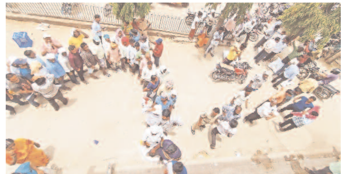
జీలుగ, పల్లికోట్ల విత్తనాల కోసం రైతులు పడిగాపులు పడుతున్నారు. గంటల తరబడి లైన్లో నిలిచిస్తున్నారు. కామారెడ్డి జిల్లాకేంద్రంలోని గాంధీగంజ్లో సోమవారం ఉదయం నుంచి జీలుగ విత్తనాల కోసం బారులు తీలిన రైతులు