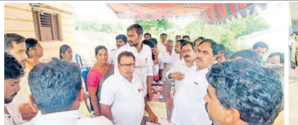
దేవరపల్లె: పోలింగ్ సరళిని పరిశీలిస్తున్న మాజీ మంత్రి ఎర్రబెల్లి