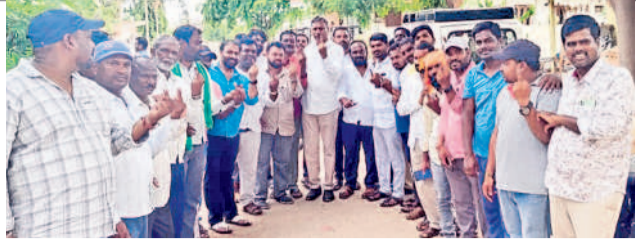
నర్సెట్లో పట్టభద్రులు, బీఆర్ఎస్ నాయకులతో ఎమ్మెల్యే పల్లా