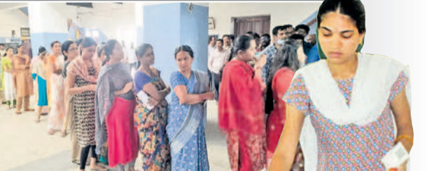
జనగామ: ప్రెస్టన్ స్కూల్ పోలింగ్ కేంద్రం..