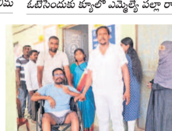
జనగామ: ఓటింగ్ సరళిని పరిశీలించిన ఎమ్మెల్యే పల్లా