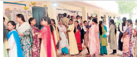
లింగాలఘనపూర్ : పోలింగ్ కేంద్రం వద్ద పోలింగ్ పట్టభద్రులు