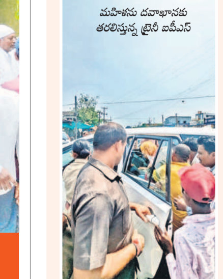
మహిళను దవాఖానకు తరలిస్తున్న ట్రైని ఐపీఎస్

వినియోగదారు, మే 27: రోడ్డు ప్రమాదంలో తీవ్రగాయాలపాలైన ఓ మహిళను అటుగా వెళ్తున్న ట్రైని ఐపీఎస్ చైతన్యార్థి తన వాహనంలో చికిత్స నిమిత్తం దవాఖానకు తరలించి మానవత్వం చాటుకున్నారు. వివరాలు ఇలా ఉన్నాయి. నిజామాబాద్ నగరంలోని చండ్రాపల్ కాల్ని చౌరస్తా వద్ద కొత్త కలెక్టరేట్ వైపు సూర్యపై వెళ్తున్న మహిళను అటుగా వచ్చిన కారు ఢీ కొట్టింది. దీంతో సూర్యపై నడుపుతున్న మహిళ ఎగిరి కారు అడ్డుపెట్టింది. కారు నడిపిన వ్యక్తిని స్థానికులు పట్టుకొని చికిత్సాధారణకు యత్నించగా అప్పటికే పోలీసులు ఘటనాస్థలానికి చేరుకున్నారు. అదే సమయంలో రూరల్ పోలీస్ స్టేషన్ నుంచి పోలీసు వాహనంలో వెళ్తున్న ట్రైని ఐపీఎస్ చైతన్యార్థి ప్రమాదాన్ని గమనించి వెంటనే అక్కడికి చేరుకున్నాడు. గాయాలపాలైన మహిళను తన పోలీసు వాహనంలో ఎక్కించుకొని చికిత్స నిమిత్తం దవాఖానకు తీసుకెళ్లాడు. కారు నడుపుతూ ప్రమాదానికి కారణమైన వ్యక్తిని పోలీస్ స్టేషన్ కు తరలించారు.