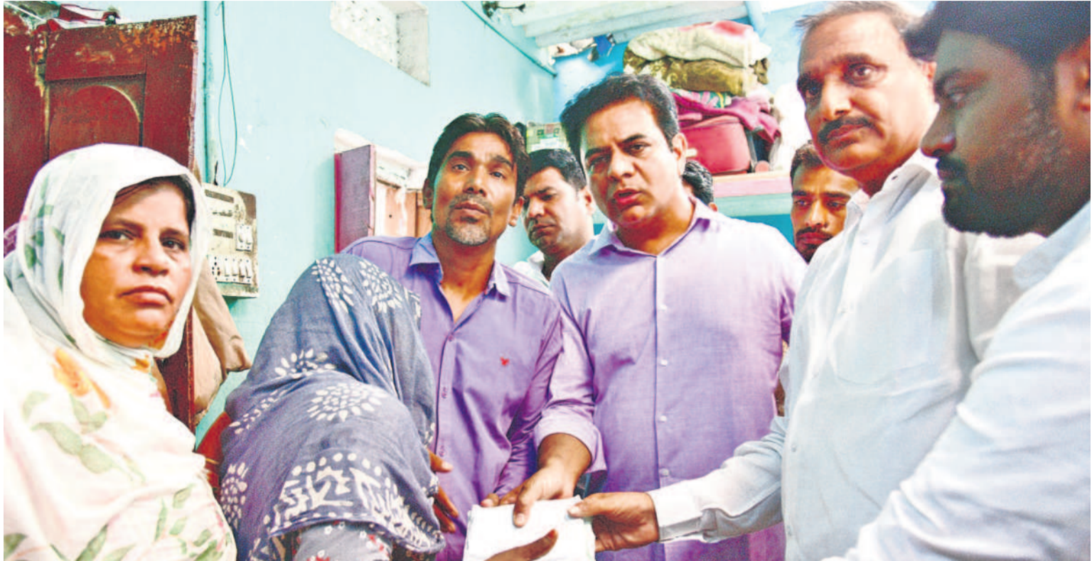
హాఫీజ్ పేట సాయినిగర్ యాత్ కాల్నీలో చనిపోయిన చిన్నారి సమర్ కుటుంబానికి ఆర్థిక సాయం అందజేస్తున్న జీఆర్ఎస్ వర్కొంగ్ పైసిడెంట్ కేటీఆర్, ఎమ్మెల్యే గాంధీ