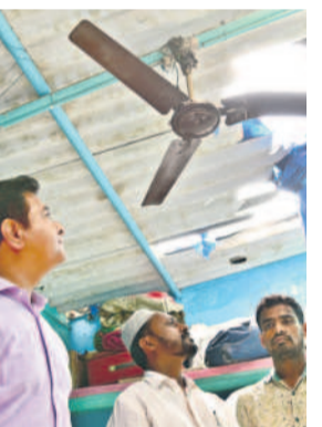
జి.కె.ఎస్. రేకుల పార్లమెంటు సభ్యులు జీఆర్ఎస్ వర్కొంగ్ పైసిడెంట్ కేటీఆర్

బాధిత కుటుంబాలను తక్షణమే ఆదుకోవాలి జీఆర్ఎస్ వర్కొంగ్ పైసిడెంట్ కేటీఆర్ హాఫీజ్ పేటలో బాధిత కుటుంబాలకు పరామర్శ లక్ష రూపాయల ఆర్థిక సాయం అందజేత