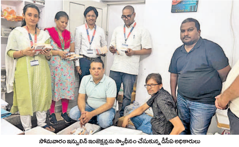
సోమవారం ఇన్సులైన్ ఇంజక్షన్లను స్వాగతించే సమయంలో డీసీపి అధికారులు