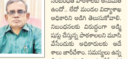
ఇమె సీట్ చేస్తాం. అనుమతులు లేని పాఠశాలల్లో విద్యార్థులను చేర్చుకోద్దు.