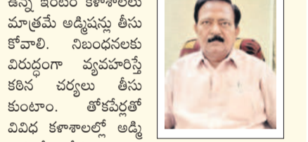
జిల్లాలో అనుమతులు ఉన్న ఇంటర్ కళాశాలలు మాత్రమే అడ్మిషన్లు తీసుకోవాలి. నిబంధనలకు విరుద్ధంగా వ్యవహరిస్తే కఠిన చర్యలు తీసుకుంటాం. తోకపేర్లతో వివిధ కళాశాలల్లో అడ్మిషన్లు తీసుకోవద్దు. కార్పొరేట్ కళాశాలలకు అనుమతులు రాలేదు. అనుమతులు వచ్చిన తర్వాతే అడ్మిషన్లు తీసుకోవాలి.