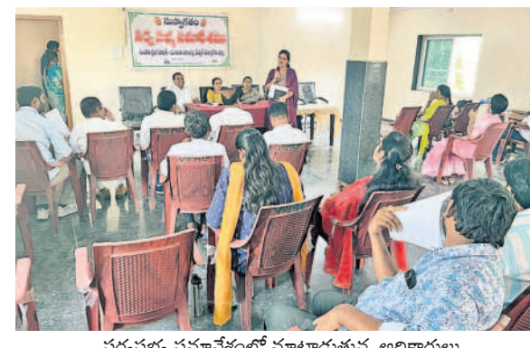
సర్వసభ్య సమావేశంలో మాట్లాడుతున్న అధికారులు

కుటుంబసభ్యులతో కలిసి నివాసముంటు న్నాడు. కొంత కాలంగా అతను అనారో గ్యంతో బాధపడుతున్నాడు. ఈ నెల 22న