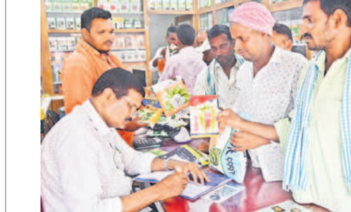
వరంగల్ స్టేషన్ రోడ్ లోని విత్తన షాపులో రైతులు