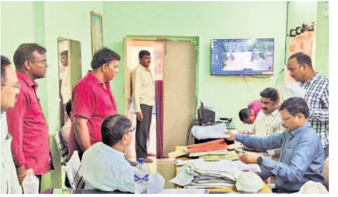
మహబూబాబాద్ ఆర్థివో కార్యాలయంలో తనిఖీలు చేస్తున్న ఏసీబీ అధికారులు