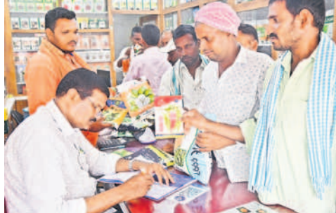
వరంగల్ స్టేషన్ రోడ్ లోని విత్తన షాపులో రైతులు