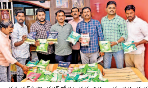
వరంగల్ ఏకశిలనగర్ లో పట్టుకున్న విత్తనాలను ప్రదర్శిస్తున్న వ్యవసాయ శాఖ, టాన్స్ ఫోర్స్ అధికారులు