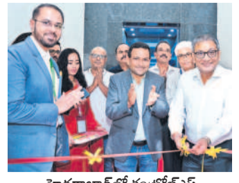
హైదరాబాద్‌లో కంట్రిల్ ఎస్ డాటా సెంటర్‌ను ప్రారంభిస్తున్న దృశ్యం