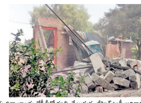
దుండిగల్ లో... నిర్మాణాలను జేసీబీటీ కూల్చి వేయిస్తున్న జీహెచ్ఎస్ఐ అధికారులు

శేరిలింగంపల్లి, మే 29 : శేరిలింగంపల్లి సిగ్నల్ పరిధిలోని జాబ్ గూడ పెద్దచెరువు బస్ స్టేషన్ లో వెలిసిన అక్రమ నిర్మాణాలను జీహెచ్ఎస్ఐ అధికారులు బుద్ధవారం కూల్చివేశారు. వెస్ట్ కోస్ట్ కమిషన్ స్వేచ్ఛ శుభంపై ఆదేశాలు మేరకు పెద్ద చెరువు బస్ స్టేషన్ లో నిబంధనలకు విరుద్ధంగా నిర్మించిన ప్రైవేట్ ప్రభుత్వంపై కూల్చివేతలు చేపట్టారు. విలువైన చెరువు స్థలాలను అక్రమింపి అక్రమ నిర్మాణాలు చేపడితే కఠిన చర్యలు తప్పవని ఈ సందర్భంగా జేసీబీటీ కమిషన్ హెచ్చరించారు.