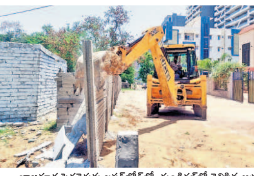
జాబ్ గూడ పెద్దచెరువు బస్ స్టేషన్ లో, దుండిగల్ లో వెలిసిన అక్రమ నిర్మాణాలను జేసీబీటీ కూల్చి వేయిస్తున్న జీహెచ్ఎస్ఐ అధికారులు