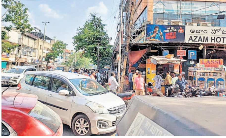
మహాత్మా గాంధీ రోడ్డులో ఇరువైపులా పుట్పాత్లను అక్రమించి వ్యాపారాలు సాగిస్తున్న పుట్పాత్లను

సికింద్రాబాద్ పట్టణానికి మహాత్మా గాంధీ రోడ్డు గుండె కాయ లాంటిది. అలాంటి ఈ రోడ్డు పూర్తిగా పుట్పాత్ ఆక్రమణలతో కుంచించబడిపోయింది. ఇంటి నగరాలను కలిపే ఈ రోడ్డు లక్షలలో ప్రధాన రహదారి. పార్కర్లతో నుండి మహాత్మా గాంధీ రోడ్డు మీదుగా ట్యాంకబండ్, మినిస్టర్ రోడ్డు, రాజ్ గంజ్, రాష్ట్రపతి రోడ్డు, మహంకాళి వీధి, టుబాకో బజార్, పార్కులైన్ సెంటర్ను కలుపుతూ ఈ రోడ్డు కొనసాగుతున్నది. రోడ్డుకు ఇరువైపులా పెద్ద పెద్ద షాపులు ఉన్నాయి. వినయోగిదారులు, పాదచారులు సడీవేందుకు రోడ్డుకు ఇరు వైపులా జీహెచ్ఎంసీ పుట్పాత్లను ఏర్పాటు చేసింది. కానీ కొంతకాలంగా ఈ రోడ్డులో పుట్పాత్లతో పాటు వివిధ రకాల వ్యాపారాలు అధికంగా వెలిశాయి. - బేగంపేట్, మే 31