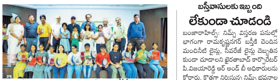
విజేతలకు బహుమతులు అందజేసిన ఎన్ టీపీసీ అధికారులు

బస్టిలాల్ పేట్, మే 31: నేపథ్య ధర్మ పర కార్పొరేషన్ (ఎన్ టీపీసీ) సంస్థ ఆధ్వర్యంలో దక్షిణ ప్రాంతీయ కేంద్ర కార్యాలయం ద్వారా చేపడుతున్న కార్పొరేట్ సంస్థల సామాజిక బాధ్యత కార్యక్రమాలలో భాగంగా మే 16 నుంచి 31 వరకు జరిగిన స్వచ్ఛతా పోటీలను శుక్రవారం ముగిసాయి. ఈ సందర్భంగా జీహెచ్ఎంసీ సహకారంతో చార్మినార్ వద్ద పాఠశాల కార్యక్రమం, పలు పాఠశాలల విద్యార్థులకు పర్యావరణం గురించి, ప్లాస్టిక్ వినియోగం వలన కలిగే అనర్థాల గురించి అవగాహన కల్పించేందుకు ప్లాస్టిక్ వాడకాన్ని నివారించాలనే అంశపై చిత్రలేఖనం, వ్యాసరచన, ముక్కలు నాటి కార్యక్రమాలను నిర్వహించామని అధికారులు తెలిపారు. విజేతలకు బహుమతులు అందజేసిన ఎన్ టీపీసీ అధికారులు