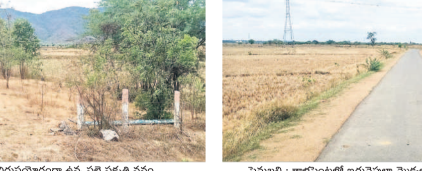
పెనుబద్ది : తాళ్లపంటలో ఇరువైపులా మొక్కలు లేకుండా ఖాళీగా దర్శనమిస్తున్న బీటీ రోడ్డు

జిల్లావ్యాప్తంగా ఒక్కో మండలంలో 8 నుంచి పది ఎకరాల విస్తీర్ణంలో 110 బ్యూహాట్ పల్లె ప్రకృతి వనాలు గత కేసీఆర్ ప్రభుత్వ హయాంలో ఏర్పాటు చేశారు. వాటిలో పూర్తిస్థాయిలో స్థలం లేకపోవడంతో 105 వరకే అందుబాటులోకి తెచ్చారు. కానీ.. వాటిలో ఏపుగా పెరిగిన మొక్కలకు నీరందించడం ఎండిపోయాయి. దీంతోపాటు జిల్లాలో 1,280 క్రీడా ప్రాంగణాల ఏర్పాటుకు స్థలం సేకరించగా.. అందులో 686 ప్రాంగణాల స్థలం దొరికింది. అయితే నిర్వహణ లేకపోవడంతో ఆయా ప్రాంగణాల్లో నాటి మొక్కలన్నీ పశువుల పాలయ్యాయి. 90,394 మొక్కలు క్రీడా ప్రాంగణాల్లో ఉండాలి ఉండగా.. అందులో అనుకున్న స్థాయిలో మొక్కలు లేకపోవడంపై క్రీడాకారులు విపరీత విరుస్తున్నారు.