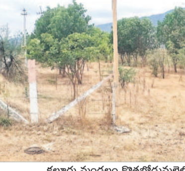
కల్లూరు మండలం కొత్తబోడుపల్లెలో నిరుపయోగంగా ఉన్న పల్లె ప్రకృతి వనం

పల్లె ప్రకృతి వనాలు, పార్కుల్లో కనిపించని పచ్చదనం జిల్లాలో గత కేసీఆర్ ప్రభుత్వ హయాంలో 751 గ్రామాల్లోని పల్లె ప్రకృతి వనాల్లో 12.89 కోట్ల మొక్కలను నాటారు. అర్బన్ పార్కుల్లో సుమారు కోటి మొక్కలు నాటి కార్యక్రమం చేపట్టారు. ప్రతి మండలంలో 10 ఎకరాల్లో బ్యూహాట్ పల్లె ప్రకృతి వనాలు ఉండాలన్న సంకల్పంతో ప్రభుత్వం