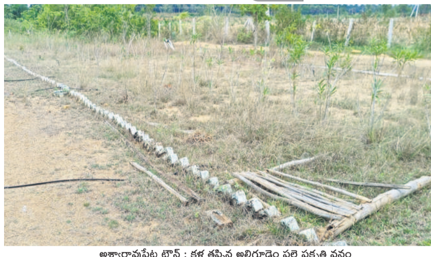
అశ్వారూపేట టౌన్ : కళ తప్పిన అల్లిగూడెం పల్లె ప్రకృతి వనం

మొక్కలు విరివిగా నాటితే.. ప్రస్తుత కాంగ్రెస్ పాలనలో వాటి అలనా పాలనా చూసే నాడుడే లేదు. మొక్కలు నాటి కార్యక్రమానికి గత కేసీఆర్ ప్రభుత్వ హయాంలో జిల్లావ్యాప్తంగా రూ. 50 కోట్లు కేటాయించి ప్రత్యేక చర్యలు చేపట్టారు. అన్ని పంచాయతీల పరిధిలోని నర్సరీల్లో ప్రస్తుతం 50 లక్షల మొక్కలు పెరుగుతున్నాయి. కానీ.. రాష్ట్ర ప్రభుత్వం హరితహారం పథకం అమలుపై ఎలాంటి మార్గదర్శకాలు అధికారులకు జారీ చేయలేదు. దీంతో పెంచిన మొక్కలు నాటాలా.. వద్దా.. అనే సందేహం అధికారుల్లో తలెత్తుతోంది. ఇప్పటికే డీఆర్డీ, మైనింగ్, పరిశ్రమలు, అటవీ, పంచాయతీరాజ్ శాఖలకు నిర్దేశిత లక్ష్యాలను గత కేసీఆర్ ప్రభుత్వం జారీ చేసి ఉన్నదికీ ప్రస్తుత ప్రభుత్వం అది అమలు చేస్తుందా? లేదా? అనేది తెలియాల్సి ఉంది.