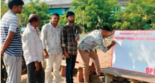
సంతకాల సేకరణ ప్రారంభిస్తున్న ఎస్ఎఫ్ఐ నాయకులు