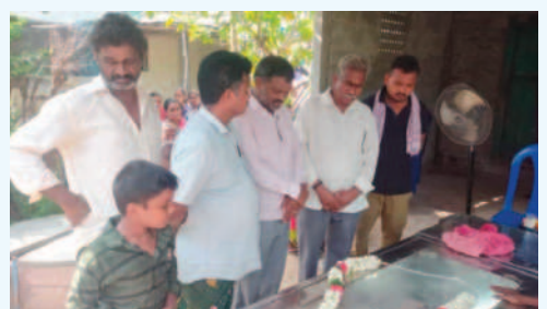
నివాళులు అర్పిస్తున్న బీఆర్ఎస్ నాయకులు