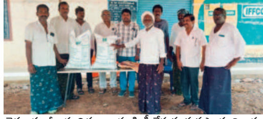
రైతులకు జీలుగు విత్తనాలు పంపిణీ చేస్తున్న వ్యవసాయాధికారులు

వేంసూరు, మే 31: మండలంలోని కేకే మల్లెల సాఫ్ట్వేర్ వ్యవసాయాధికారులు రైతులకు సబ్సిడీపై జీలుగు విత్తనాలను శుభ్రవారం పంపిణీ చేశారు. మండల వ్యవసాయాధికారి రామోజునారావు మాట్లాడుతూ.. సాఫ్ట్వేర్ పరిధిలో 500 క్వింటాళ్ళ విత్తనాలు అందజేయడానికి ఉంచామని తెలిపారు. కార్యక్రమంలో ఏకాదశి, సాఫ్ట్వేర్ నిపుణులు పాల్గొన్నారు.