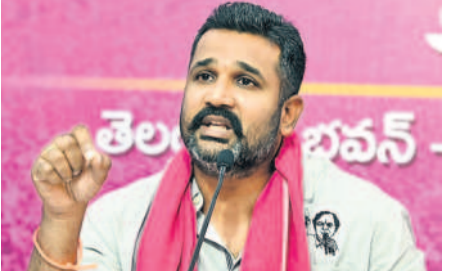
ఉండని, తెలంగాణను కూడా లూటీ చేసేందుకు ఈ కంపెనీని ఇక్కడికి తీసుకొస్తానా? అని ప్రశ్నించారు.