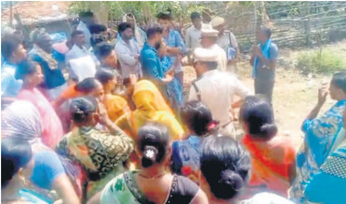
భూముల సర్వే కోసం వచ్చిన అటవీ అధికారులను అడ్డుకుంటున్న గ్రామస్థులు, రైతులు

ఇటీవల కుంగడలో ఘర్షణ • తాజాగా దానాపూర్లో సర్వే కోసం వచ్చిన సిబ్బందిని అడ్డుకున్న రైతులు, గ్రామస్థులు • తీవ్రంగా ప్రతిఘటించడంతో వెనుదిరిగిన వైసీపీ • రోజూ రోజూకూ వేధింపులు ఎక్కువ అవుతున్నాయని అన్న దాతల ఆవేదన • గ్రామం కూడా అటవీ భూమిలోనే ఉంది • ఆసిఫాబాద్ అటవీ డివిజన్ లో అధికారి అప్పల కొండ