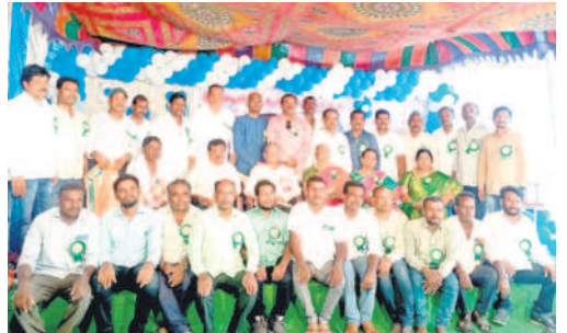
1995-96 బ్యాచ్ విద్యార్థులు

దండేపల్లి, మే 31 : మండలంలోని ద్వారక జిడ్చి ఉన్నత పాఠశాలలో శుక్రవారం 1995-96 బ్యాచ్ పడో తరగతి విద్యార్థులు సమ్మేళనం నిర్వహించారు. చదువులు ముగించుకొని భవిష్యత్తును వెతుక్కుంటూ వెళ్లిన వారంతా 29 ఏళ్ల తర్వాత ఒకే వేదికపై చేరి సందడి చేశారు. ఒకరినొకరు ఆప్యాయంగా పలకరించుకున్నారు. నాటి జ్ఞాపకాలను మెమరీసుకున్నారు. అప్పటి గురువులను సన్మానించారు.