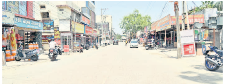
ఎండ తీవ్రతకు నిర్మాణస్వంగా మారిన అర్బన్ టిక్స్ చౌరస్తా