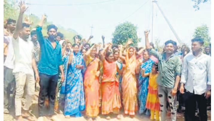
అటవీ అధికారులకు వ్యతిరేకంగా నినాదాలు చేస్తున్న గ్రామస్థులు, రైతులు

కుటుంబం ఆసిఫాబాద్, మే 31 (నమస్తే తెలంగాణ) : మంచిర్యాల మండలం మండలం కుంగడలో కొంతకాలంగా అటవీ శాఖ కు-రైతుల మధ్య భూ వివాదం రాజుకుంటుంది. 20 రోజుల క్రితం రెవెన్యూ మండలం కుంగడలో ఫారెస్ట్ అధికారులు, రైతుల మధ్య ఘర్షణ జరుగగా, తాజాగా.. శుక్రవారం ఆసిఫాబాద్ మండలం దానాపూర్లో భూముల సర్వే కోసం వచ్చిన అధికారులను, రైతులు అడ్డుకోవడం ఉద్ధిక్తలకు దారితీసింది. అటవీ అధికారులకు వ్యతిరేకంగా నినాదాలు చేశారు. ఇక చేసేదేమీ లేక అటవీ అధికారులు వెనుదిరుగాల్సి వచ్చింది. తరతరాలూ సాగు చేసుకుంటున్న భూములను అటవీ అధికారులు సర్వేల పేరుతో లాక్కుంటున్నారని గ్రామానికీ ఆసిఫాబాద్ డివిజన్ లో అటవీ అధికారి అప్పల