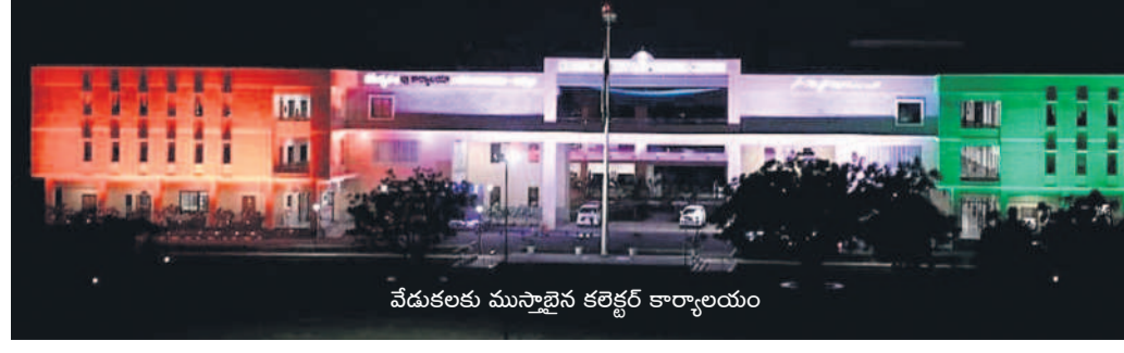
వేడుకలకు ముస్తాబైన కలెక్టర్ కార్యాలయం