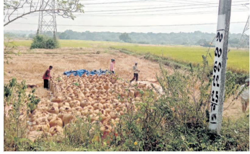
చాళకొండ పంచాయతీలో వరిపంట చేలు వద్ద ధాన్యాన్ని బస్తాల్లో నింపుతున్న రైతులు (ఫైల్)

భద్రాద్రి కొత్తగూడెం, జూన్ 1 (నమస్తే తెలంగాణ) : జిల్లావ్యాప్తంగా ఈ యాసంగిలో రైతులు పండించిన దొడ్డు రకం వడ్డు సర్కారు కొనుగోలు కేంద్రాలకు రాకుండాపోయాయి. బయట అధిక రేటు పలికిందా లేక అధికారుల నిర్లక్ష్యమే గాని గతేడాది కంటే ఈ యాసంగి వరిధాన్యం కొనుగోళ్లలో చాలా వ్యత్యాసం కొద్దివ్యాప్తంగా కనబడుతున్నది. గత యాసంగిలో కొనుగోలు కేంద్రాల ద్వారా 35,127 మెట్రిక్ టన్నుల ధాన్యాన్ని ప్రభుత్వం కొనుగోలు చేసింది. ఈ ఏడాది ఇప్పటివరకు కేవలం 13,655 మెట్రిక్ టన్నుల ధాన్యం కొనుగోలు చేయడంలో ఆంతర్యం ఏమిటో అర్థంకాని విషయంగా మిగిలింది. రైతులు పంట పండించలేదా అంటే జిల్లావ్యాప్తంగా సన్నాలు, దొడ్డు వడ్డు కలిపి 1,41,020 మెట్రిక్ టన్నుల దిగుబడి వచ్చినట్లు వ్యవసాయాధికారులు లెక్కలు చెబుతున్నారు. కానీ పౌరసరఫరాలశాఖ మాత్రం మాకు అంత అంచనా రాలేదని చెబుతున్నారు. మొత్తంగా సన్నాలు 55,680 మెట్రిక్ టన్నుల దిగుబడి కాగా, దొడ్డు రకాలు 85,340 మెట్రిక్ టన్నుల దిగుబడి వచ్చింది. ఇంత మొత్తంలో దిగుబడి వన్నీ కేవలం 13,655 మెట్రిక్ టన్నుల ధాన్యాన్ని కొనుగోలు చేయడంలో పౌరసరఫరాలశాఖ విఫలమైందనే చెప్పాలి. పౌరసరఫరాలశాఖ అధికారులు చేస్తున్న ప్రకారం మాన్యువల్ వ్యవసాయశాఖ అధికారుల లెక్కలు పక్కాగా తప్పిందే కనిపిస్తున్నది.