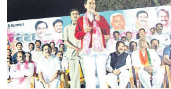
బోధన్ లో తెలంగాణ నిరాహారదీక్షలకు ఏడాది పూర్తయిన సందర్భంగా (2010 డిసెంబర్ 27న) జరిగిన బహిరంగసభలో మాట్లాడుతున్న కేసీఆర్

బోధన్, జూన్ 1: మరొక ఉద్ఘాటనలో తెలంగాణ సాధన ద్వారా బోధన్ పట్టణంలో సుదీర్ఘకాలంపాటు కొనసాగిన నిరాహారదీక్షలకు నాటి ఉద్ఘాటన నేత, తెలంగాణ రాష్ట్రం తొలి ముఖ్యమంత్రి కల్వకుంట్ల చంద్రశేఖరరావు స్ఫూర్తిప్రదాతగా నిలిచారు. కేసీఆర్ అందించిన స్ఫూర్తితో నిరాహారదీక్షలతో పాటు వివిధ రూపాల్లో తెలంగాణ పోరు బోధన్ లో ఉద్ఘాటన లేచింది. తెలంగాణ ఉద్ఘాటన చరిత్రలో బోధన్ ఓ పోరుగడ్డగా నిలిచింది. బోధన్ లో తెలంగాణ వాదులు జేపీసీగా ఏర్పడి ప్రారంభించిన నిరాహారదీక్షలకు చారిత్రాత్మక ప్రాధాన్యత ఉన్నది. ఒక పక్క రాష్ట్రవ్యాప్తంగా కేసీఆర్ పర్యటిస్తూ సాగిస్తున్న పోరాటం.. స్థానికంగా బోధన్ ప్రాంతంలోని తెలంగాణవాదులకు ఎంతో స్ఫూర్తిని ఇచ్చింది. బోధన్ లో ఏడో ఆరు నెలలో.. ఏడాది కాదు.. ఏకంగా 1519 జోలపాటు తెలంగాణవాదులు నిరాహారదీక్షలు చేశారు. తెలంగాణ ఉద్ఘాటనలోనూ, తెలంగాణ అవెర్సాను అనంతరం కూడా హైదరాబాద్ లో సభలు ప్రాంతాల్లో జరిగిన కార్యక్రమాల్లో కేసీఆర్ బోధన్ నిరాహారదీక్షల విషయాన్ని తరచుగా ప్రస్తావించేవారు. బోధన్ లో 2009 డిసెంబర్ 28న ప్రారంభమైన నిరాహారదీక్షలు 1519 రోజులపాటు.. అనగా 4 సంవత్సరాల 17 రోజులపాటు కొనసాగి 2014 ఫిబ్రవరి 23న ముగిశాయి.