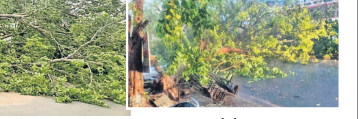
కాటారం పీహెచ్ఎస్ వద్ద రోడ్లపై వర్ష చెట్టు