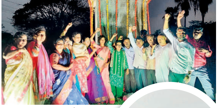
హనుమకొండలోని అమరల కీర్తి స్థూపం వద్ద తెలంగాణ రవయితల సంఘం సభ్యులు