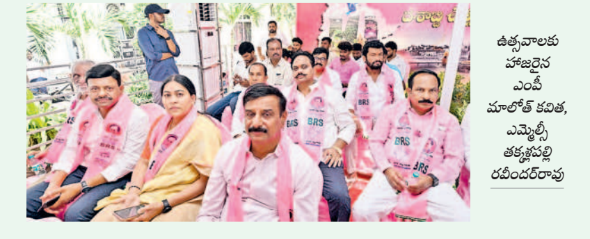
ఉత్సవాలకు హాజరైన ఎంపీ మాలోక్ కవిత, ఎమ్మెల్యే తక్కళ్లపల్లి రవీంద్రరావు