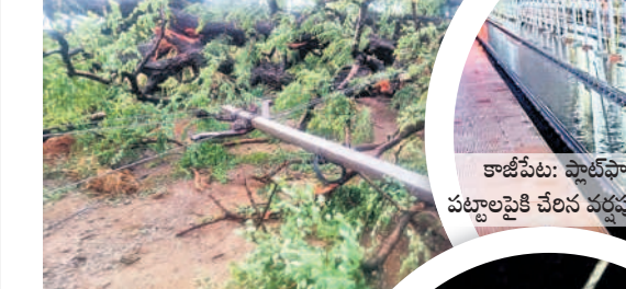
కాజీపేట: ప్లాట్ ఫాం పట్టణంపైకి చేరిన వర్షపు నీరు