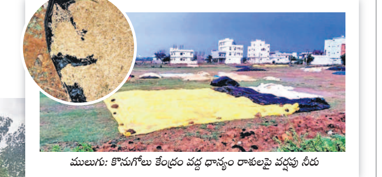
ములుగు: కొనుగోలు కేంద్రం వద్ద ధాన్యం రాకుండా వర్షపు నీరు