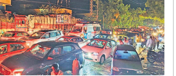
మడికొండలో చెట్టు విరిగిపడడంతో ఎక్కడిక్కడై నిలిచిపోయిన వాహనాలు