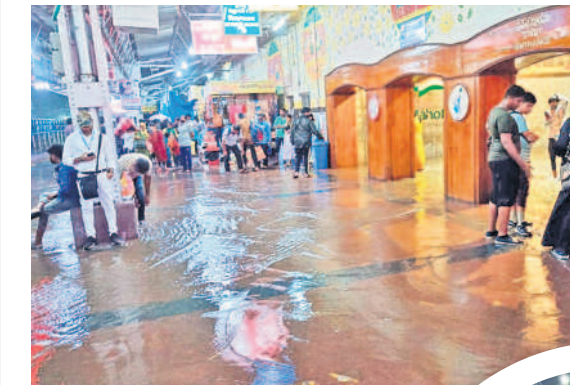
కాజీపేట రైల్వే జంక్షన్ ప్రవేశ ద్వారం వద్ద వర్షపు నీరు