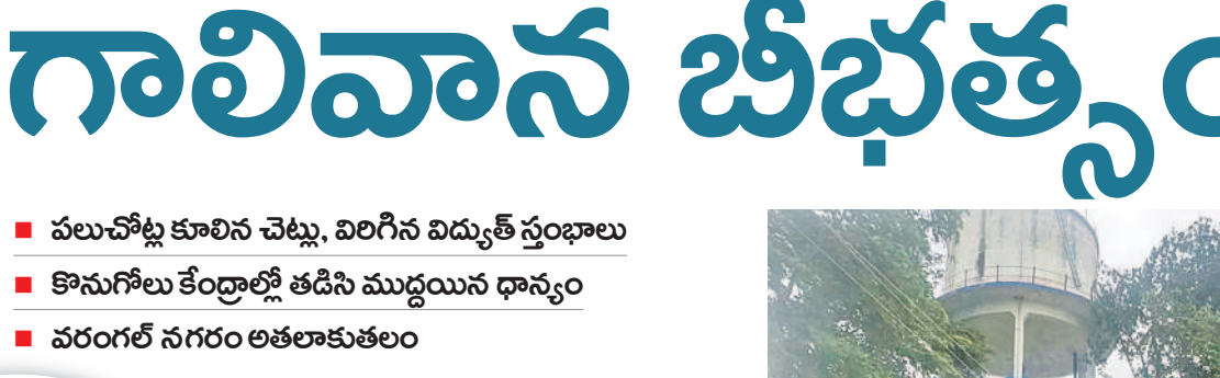
ములుగు: కొనుగోలు కేంద్రం వద్ద ధాన్యం రాకుండా వర్షపు నీరు