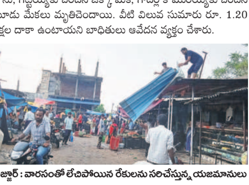
బెజ్జూర్ : వారసంతలో లేబిపోయిన రేకులను సరిచేస్తున్న యజమానులు