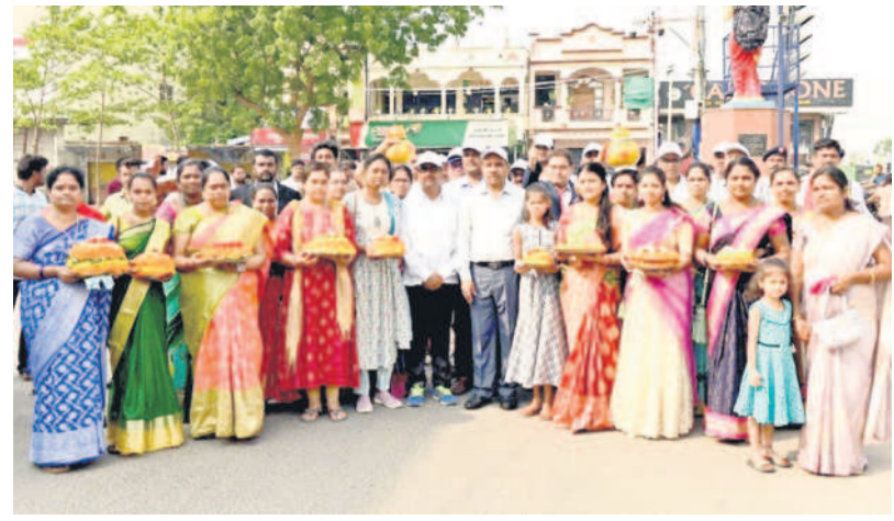
సీసీ నన్నూర్ : నన్నూర్ కాలనీలో బతుకమ్మలతో వచ్చిన మహాళతో శ్రీరాంపూర్ జి.ఎం సంబంధం