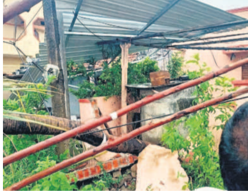
చెన్నూర్ దూరలో : కిష్టంపేటలో లేబిపోయిన రేకులు