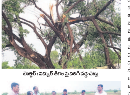
బెజ్జూర్ : విద్యుత్ తీగలపై విరిగి పడ్డ చెట్టు