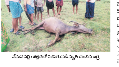
వేమనపల్లి : జిల్లాలో పెడుగు పడి మృతి చెందిన బర్రె