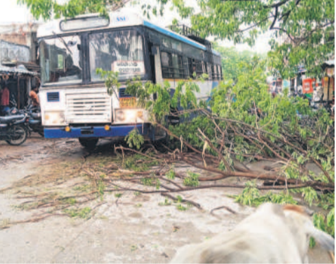
బెజ్జూర్ : మండల కేంద్రంలోని ప్రధాన రహదారిపై విరిగిపడ్డ వృక్షం