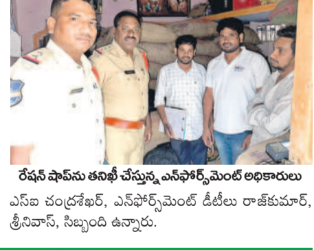
రేపల్లె షాప్ ను తనిఖీ చేస్తున్న ఎన్ఫోర్స్ మెంట్ అధికారులు