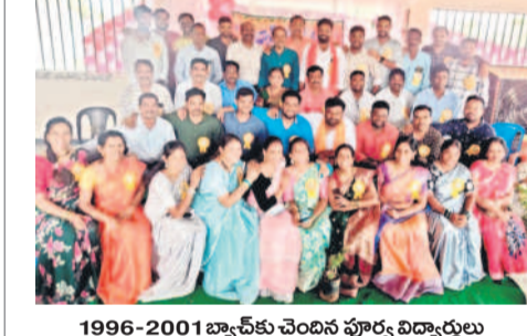
1996-2001 బ్యాచ్ కు చెందిన పూర్వ విద్యార్థులు