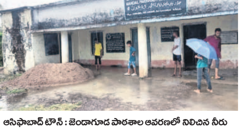
ఆసిఫాబాద్ టౌన్ : జెండాగూడ పాఠశాల ఆవరణలో నిలిచిన నీరు