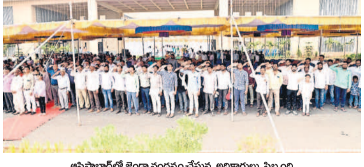
ఆసిఫాబాద్ లో జెండా వందనం చేస్తున్న అధికారులు, సిబ్బంది