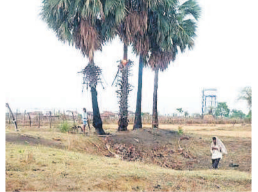
పెంచకల్ పేట్ : కొండపల్లిలో పెడుగుపడి కాలుకున్న తాడిచెట్టు