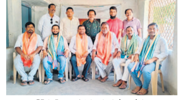
రెవెన్యూ : తెలంగాణ ఉద్భవమునకు సన్మానిస్తున్న గోలేటి వెల్డర్ సాస్వితి సభ్యులు