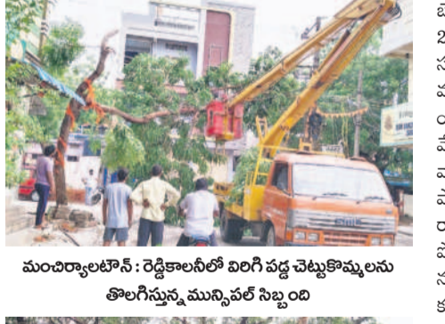
మంచీర్యాలలో: రెడ్డి కాలనీలో విరిగి పడ్డ చెట్టు కొమ్మలను తొలగిస్తున్న మున్సిపల్ సిబ్బంది