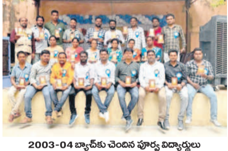
2003-04 బ్యాచ్ కు చెందిన పూర్వ విద్యార్థులు

దండేపల్లి, జూన్ 2 : దండేపల్లిలోని భారతి విద్యానికేతన్ కళాశాలలో 1996-2001 స్టైమర్ బ్యాచ్ కు చెందిన పూర్వ విద్యార్థుల సమ్మేళనం నిర్వహించారు. చదువులు ముగించుకొని భవిష్యత్తును వెతుక్కుంటూ వెళ్లిపోయిన అపూర్వ విద్యార్థులకు ఒకేచోట చేరి సందడి చేశారు. ఒకరికొకరు అప్యాయంగా పలకరించుకున్నారు. నాటి జ్ఞాపకాలను నెమరెసుకున్నారు. అనంతరం గురువులను సన్మానించారు.