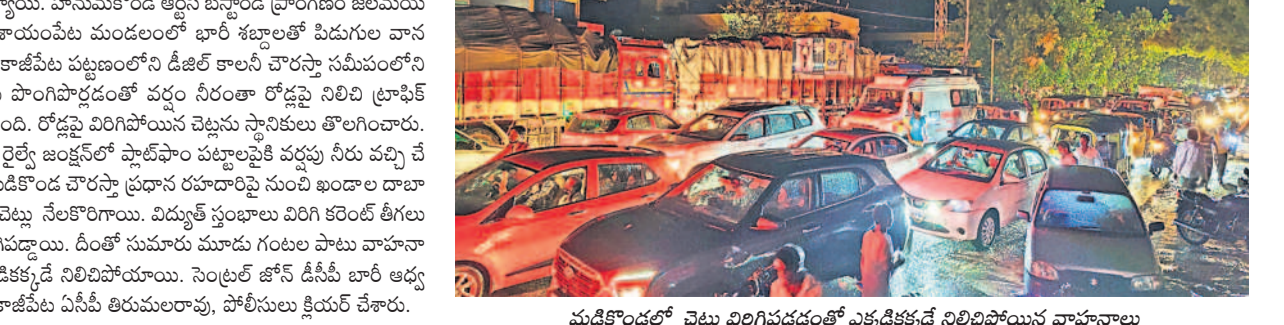
మడికొండలో చెట్టు విరిగిపడడంతో ఎక్కడిక్కడై నిలిచిపోయిన వాహనాలు