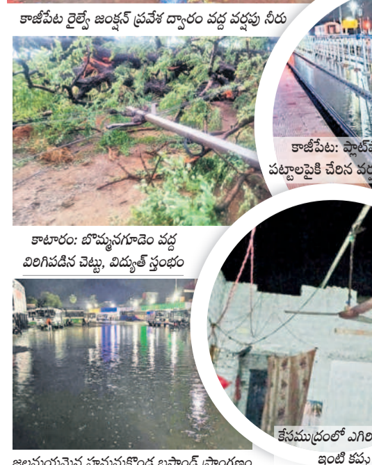
జలమయ్యైన హనుమకొండ బస్టాండ్ ప్రాంగణం ఇంటి కప్ప