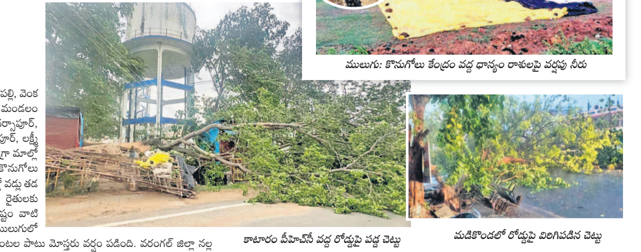
కాటారం పీహెచ్ఎస్ వద్ద రోడ్లపై వడ్డు చెట్లు మడికొండలో రోడ్లపై విరిగిపడిన చెట్లు