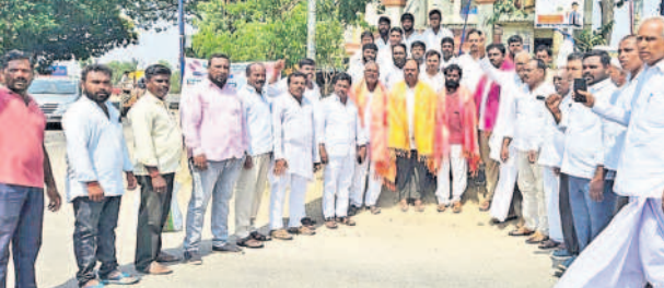
హత్తూరు: హోల్కాబాద్లో ఉధృతకారులను సన్మానిస్తున్న బీఆర్ఎస్ నాయకులు