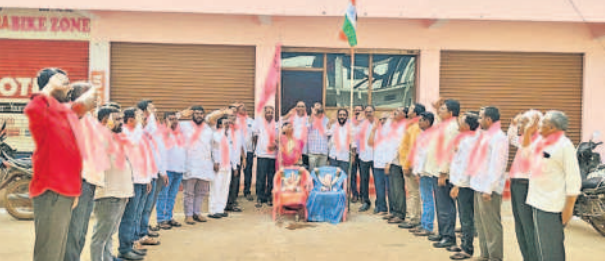
కోపిర: జాతీయ జెండా, గులాబీ జెండాను ఎగురవేసిన బీఆర్ఎస్ నేతలు