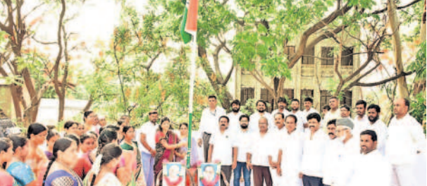
సదాశివపేట: జెండాను ఆవిష్కరిస్తున్న మున్సిపల్ చైర్మన్ అప్పారాజుపాటి