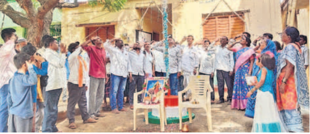
న్యాలికోల్: మల్లిక్ జెండాకు వందనం చేస్తున్న ప్రజాప్రతినిధులు, ప్రజలు