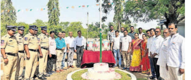
జిన్నారం: జాతీయ జెండాకు వందనం చేస్తున్న తహసీల్దార్ బిక్షపతి, ఉద్యోగులు