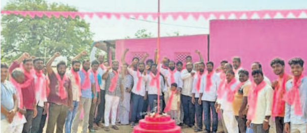
కంబి: బేగంపేట గ్రామంలో గులాబీ జెండాను ఎగురవేసిన బీఆర్ఎస్ నాయకులు