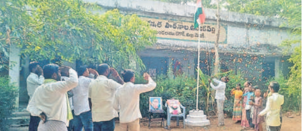
పట్టిపల్లి: ఉనికపల్లి పాఠశాలలో జెండా ఆవిష్కరిస్తున్న ఉపాధ్యాయుడు