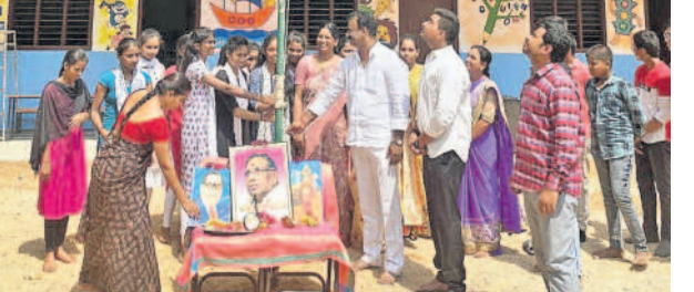
బోల్లారం: ఆక్స్ ఫర్ట్ హైస్కూల్లో జాతీయ జెండా ఆవిష్కరణ