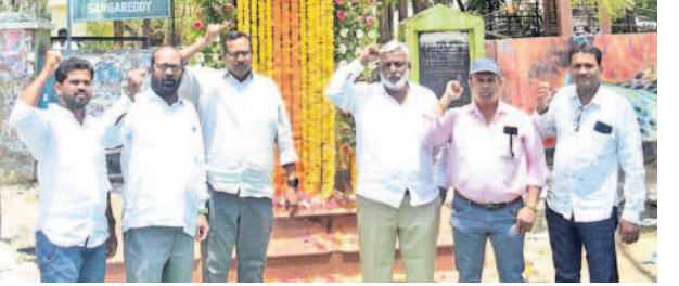
సంగారెడ్డి కలెక్టరేట్: బి.బీ వద్ద నివాళులర్పిస్తున్న టీఎన్ఆర్ నాయకులు