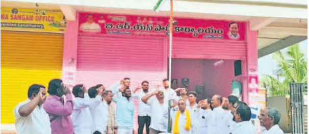
నారాయణభేడ్: బీఆర్ఎస్ కార్యాలయం జెండా వందనం చేస్తున్న నాయకులు