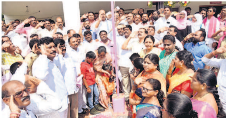
హనుమకొండలో జెండా వందనం చేస్తున్న ఎమ్మెల్యే సారయ్య, దాస్యం, పెద్ది తదితరులు