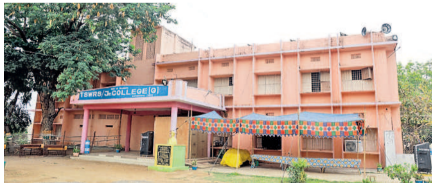
మానుకోట తెలంగాణ సాంఘిక సంక్షేమ గురుకుల పాఠశాలలోని కొంటింగ్ కేంద్రం

మహబూబాబాద్ లో కొనభ సంబంధించి జిల్లా కేంద్రంలోని తెలంగాణ సాంఘిక సంక్షేమ గురుకుల పాఠశాల, జూనియర్ కళాశాలలో కొంటింగ్కు ఏర్పాటు చేశారు. పార్లమెంట్ పరిధిలో మొత్తం 15,92,366 మంది ఓటర్లకు 11,01,030 ఓట్లు (71.85%) పోలయ్యాయి. భద్రాచలం, పిసపాక, ఇల్లెండు, ములుగు, నర్సంపేట, మహబూబాబాద్, డోర్నాల్ అసెంబ్లీ స్థానాల వేర్వేరుగా కొంటింగ్ నిర్వహించనున్నారు. ఒక్కో రౌండ్కు 14 టేబుళ్లు ఏర్పాటు చేశారు. మొత్తం 132 రౌండ్లలో లెక్కింపు ప్రక్రియను పూర్తి చేయనున్నారు. డోర్నాల్ నియోజకవర్గంలో 19 రౌండ్లు, మహబూబాబాద్-21, నర్సంపేట-21, ములుగు-22, పిసపాక-18, ఇల్లెండు-18, భద్రా