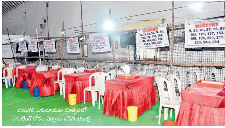
వరంగల్ ఎనుమాముల మార్కెట్లో కొంటింగ్ కోసం ఏర్పాటు చేసిన టేబుళ్లు