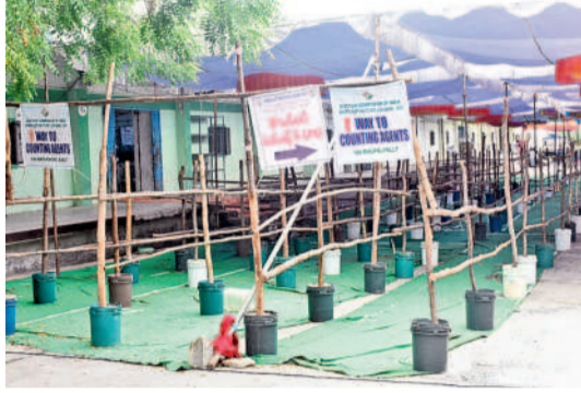
కొంటింగ్ కోసం చేసిన ఏర్పాట్లు

పార్లమెంట్ ఎన్నికల ఫలితాలపై నెలకొన్న ఉత్కంఠకు నేడు తెరవడం. వరంగల్, మహబూబాబాద్ లో కొనభ స్థానాలకు మే 13న ఎన్నికలు జరుగగా మంగళవారం ఓట్లను లెక్కించేందుకు అధికార యంత్రాంగం సర్వం సిద్ధం చేసింది. ఉదయం 8 గంటలకు కొంటింగ్ మొదలుకానుండగా వరంగల్ సెర్వీస్ కేంద్రం నంబూరిచి ఎనుమాముల మార్కెట్లో, మానుకోటలో తెలంగాణ సాంఘిక సంక్షేమ గురుకుల పాఠశాల, జూనియర్ కళాశాలల్లో మూడంచెల భద్రత ఏర్పాటు చేశారు. వరంగల్లో 127 రౌండ్లు, 124 టేబుళ్లు, మానుకోటలో మొత్తం 132 రౌండ్లు, 98 టేబుళ్ల ద్వారా లెక్కింపు జరుగుతున్నాయి. తొలుత పోస్టల్ బ్యాలెట్, హోం ఓటింగ్, సర్వీస్ ఓట్లను లెక్కించనున్నారు.