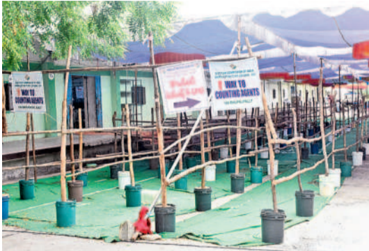
కౌంటింగ్ కోసం చేసిన ఏర్పాట్లు

పార్లమెంట్ ఎన్నికల ఫలితాలపై నెలకొన్న ఉత్కంఠకు నేడు తెరవడం. వరంగల్, మహబూబాబాద్ లోక్ సభ స్థానాలకు మే 13న ఎన్నికలు జరుగగా మంగళవారం ఓట్లను లెక్కించేందుకు అధికార యంత్రాంగం సర్వం సిద్ధం చేసింది. ఉదయం 8 గంటలకు కౌంటింగ్ మొదలుకానుండగా వరంగల్ సెర్వెంట్ కు సంబంధించి ఎనుమాముల మార్కెట్లో, మానుకోటలో తెలంగాణ సాంఘిక సంక్షేమ గురుకుల పాఠశాల, జూనియర్ కళాశాలల్లో మూడంచెల భద్రత ఏర్పాటు చేశారు. వరంగల్ లో 127 రౌండ్లు, 124 టేబుళ్లు.. మానుకోటలో మొత్తం 132 రౌండ్లు, 98 టేబుళ్ల డ్వారా లెక్కింపు జరుగనున్నాయి. తొలుత పోస్టల్ బ్యాలెట్, హోం ఓటింగ్, సర్వీస్ ఓట్లను లెక్కించనున్నారు.