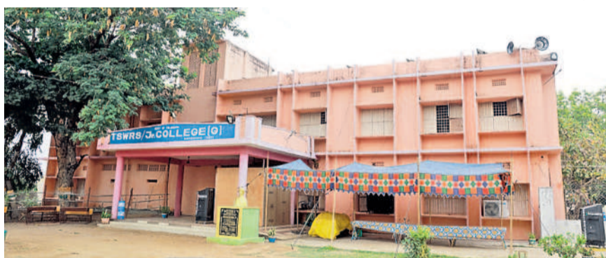
మానుకోట తెలంగాణ సాంఘిక సంక్షేమ గురుకుల పాఠశాలలోని కౌంటింగ్ కేంద్రం

మహబూబాబాద్ లోక్ సభకు సంబంధించి జిల్లాకేంద్రంలోని తెలంగాణ సాంఘిక సంక్షేమ గురుకుల పాఠశాల, జూనియర్ కళాశాలలో కౌంటింగ్ కేంద్రాలు ఏర్పాటు చేశారు. పార్లమెంట్ పరిధిలో మొత్తం 15,32,366 మంది ఓటు ధృవండా 11,01,030 ఓట్లు (71.85%) పోలయ్యాయి. భద్రాచలం, పిసపాక, ఇల్లెందుల, ములుగు, నర్సంపేట, మహబూబాబాద్, డోర్నకల్ అసెంబ్లీ స్థానాలకు వేర్వేరుగా కౌంటింగ్ నిర్వహించనున్నారు. ఒక్కో రౌండ్ కు 14 టేబుళ్లు ఏర్పాటు చేశారు. మొత్తం 132 రౌండ్లలో లెక్కింపు ప్రక్రియను పూర్తి చేయనున్నారు. డోర్నకల్ నియోజకవర్గంలో 19 రౌండ్లు, మహబూబాబాద్-21, నర్సంపేట-21, ములుగు-22, పిసపాక-18, ఇల్లెందుల-18, భద్రా