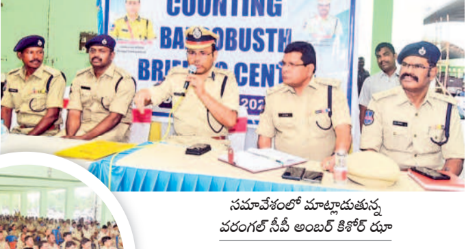
సమావేశంలో మాట్లాడుతున్న వరంగల్ సీపీ అంబర్ కిశోర్ ధూ

కాశీబగ్గ, జూన్ 3: వరంగల్ పార్లమెంట్ ఎన్నికల ఓట్ల లెక్కింపు ఫలితాలు మంగళవారం వెలువడిన తర్వాత ర్యాలీలు, సభలు నిర్వహించుకునేందుకు ఎలాంటి అనుమతి లేదని వరంగల్ సీపీ అంబర్ కిశోర్ ధూ తెలిపారు. ఓట్ల లెక్కింపు జరిగే వరంగల్ ఎనుమాముల మార్కెట్ ప్రాంగణంలో సోమవారం పోలీస్ అధికారులకు పలు సూచనలు చేశారు. అనంతరం అయిన మాట్లాడుతూ వివిధ పోలీస్ విభాగాలకు చెందిన 400 మంది పోలీస్ అధికారులతో చేపట్టిన బందోబస్తు ఏర్పాటు చేసినట్లు తెలిపారు. ఓట్ల లెక్కింపు కేంద్రంలోకి ఎవీ అభ్యర్థులు, సంబంధిత ఏజెంట్లు, పానులు ఉన్నవారికి