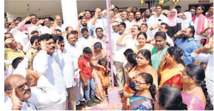
హనుమకొండలో జెండా వందనం చేస్తున్న ఎమ్మెల్యే సారయ్య, దాస్యం, పెద్ది తదితరులు