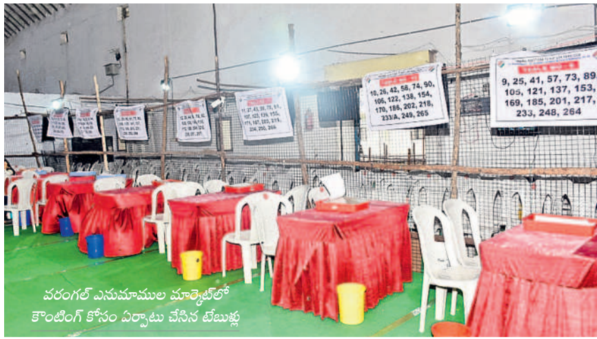
వరంగల్ ఎనుమాముల మార్కెట్లో కౌంటింగ్ కోసం ఏర్పాటు చేసిన టేబుళ్లు