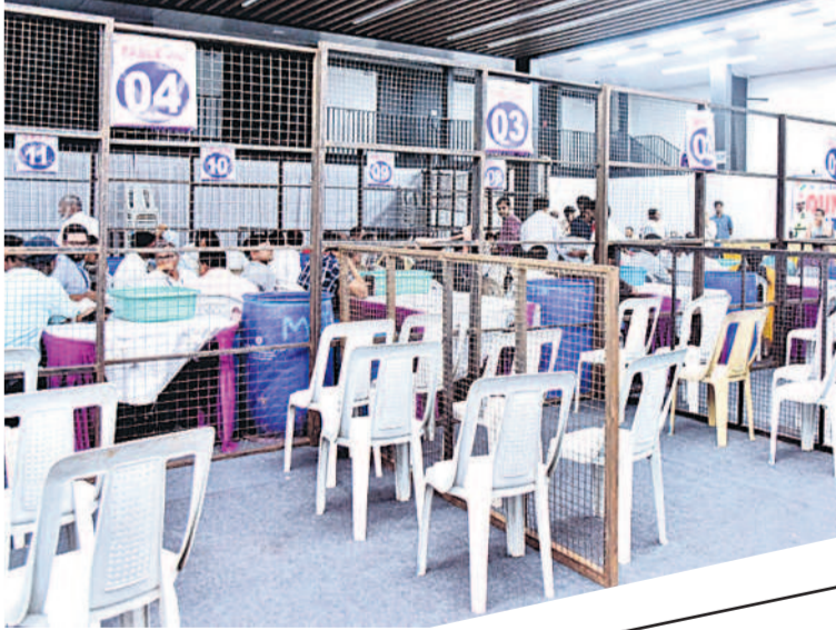
గీతం యూనివర్సిటీలో ఏర్పాటు చేసిన కౌంటింగ్ హాల్