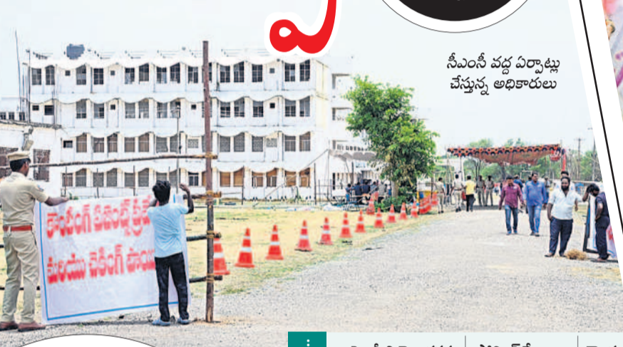
సీఎంసీ వద్ద ఏర్పాట్లు చేస్తున్న అధికారులు

కానీ ఈ ఏంబిలెంట్ కౌంటింగ్ ఫలితాలను అధికారికంగా ప్రకటించడానికి వీలేదు. సంబంధిత రిటర్నింగ్ అధికారి పర్యవేక్షణలోనే పోస్టల్ బ్యాలెట్లను లెక్కిస్తారు. ఈ ఏంబిలెంట్ లోని ఓట్ల లెక్కింపు టేబుళ్లకు అదనంగా పోస్టల్ బ్యాలెట్ కోసం ఆర్కైవ్ వద్ద ప్రత్యేక టేబుల్ ను ఏర్పాటు చేస్తారు. ఈ ఏంబిలెంట్ లో నమోదైన ఓట్ల లెక్కింపునకు నియోజకవర్గానికి 14 టేబుళ్లు సహాయకులు పోలింగ్ కేంద్రాల ఈ ఏంబిలెంట్ క్రమపద్ధతిలో తీసుకొచ్చి ఉంచుతారు. సూపర్ వైజర్ వాటిపై ఉండే రిజల్ట్ మీటను నొక్కి పార్టీల వారీగా పోల్ అయిన ఓట్లను సమూహం చేసుకుంటారు. మైక్రో అబ్జర్వర్ వాటిని పబ్లిక్ లో పొందుపర్చి ఆర్కైవ్ అందిస్తారు. అన్ని టేబుళ్ల లెక్కింపునకు కలిపి ఓ రౌండ్ ఫలితం పచ్చిపచ్చి పరిశీలన తర్వాత సంబంధిత ఆర్కైవ్, పరిశీలకులు ఫలితాన్ని వెల్లడిస్తారు. చివరి రౌండ్ ఫలితం పూర్తి యాక్టర్ అభ్యర్థి గెలుపును ఎన్నికల సంఘం అధికారికంగా ప్రకటిస్తుంది. నిజామాబాద్ లోక్ సభ నియోజకవర్గానికి రిటర్నింగ్ అధికారిగా ఉన్న కలెక్టర్ రాజీవ్ గాంధీ హానుమంతు గెలుపొందినట్లు ధృవీకరణ పత్రాన్ని అందిస్తారు.