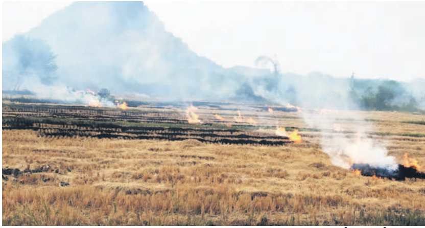
వ్యవసాయంలో పాలింట్ రైతులు తగులబెట్టిన కొయ్యకాళ్లు (ఫైల్)

కలెక్టరేట్, జూన్ 4 : లోక్సభ ఎన్నికల ఫలితాలను కలెక్టరేట్ ఎదుట డిజిటల్ స్ట్రీమ్స్ ప్రదర్శించగా, బాటసారులు ఆసక్తి వీక్షించారు. లెక్చర్లు పాటు కలెక్టరేట్ ఎదుట కూడా ఫలితాల లైవ్ ప్రదర్శించాలంటూ ఎన్నికల సంఘం ఆదేశించడంతో అధికారులు ఆదిగా ఏర్పాట్లు చేశారు.