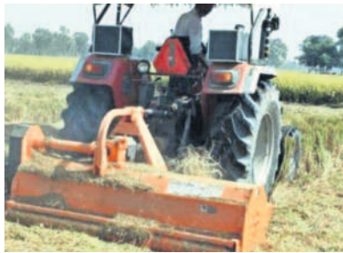
మల్చర్తో కొయ్యకాళ్లు పాలింట్ కలియదున్నుతున్న రైతు

ముక్కలుగా కత్తిరించి నేలపై సమాంతరంగా పరుస్తుంది. దీన్ని నీటి తడి పెట్టి అలాగే వారం, పది రోజుల పాటు మురగనివ్వాలి. తర్వాత దున్నితే ముక్కలుగా మారిన గడ్డి నేలలో కలిసిపోతుంది. దీంతో నేలలో తేమ శాతం పెరుగుతుంది. నేల సారవంతం అవుతుంది. నీటి కొరతను తగ్గించుకోవచ్చు. మల్చర్తో మిశ్రం చేసిన కొయ్యకాళ్లు మల్చర్తో కలిపిన రైతులు చెప్పారు.