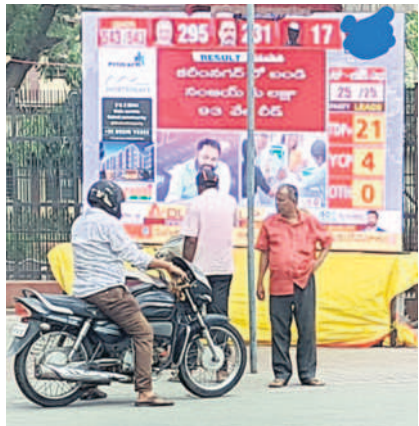
డిజిటల్ స్ట్రీమ్స్ ఫలితాల మీటింగును బాటసారులు

కలెక్టరేట్, జూన్ 4 : లోక్సభ ఎన్నికల ఫలితాలను కలెక్టరేట్ ఎదుట డిజిటల్ స్ట్రీమ్స్ ప్రదర్శించగా, బాటసారులు ఆసక్తి వీక్షించారు. లెక్చర్లు పాటు కలెక్టరేట్ ఎదుట కూడా ఫలితాల లైవ్ ప్రదర్శించాలంటూ ఎన్నికల సంఘం ఆదేశించడంతో అధికారులు ఆదిగా ఏర్పాట్లు చేశారు.