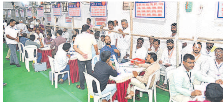
పోస్టల్ ఓట్ల లెక్కింపును పరిశీలిస్తున్న లబ్ధిగా అధికారి పవేలూ సత్తతి