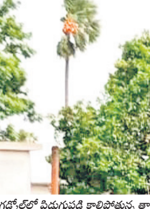
గడ్డెల్లో పడుగుపడి కాలిపోతున్న తాటిచెట్టు

భారీ వర్షం నేలకొరిగింది. దీంతో ట్రాఫిక్ జామా కావాలి. భూబాన్ధులను నిర్మూలించారు. కామారెడ్డి జిల్లా కేంద్రంలో ఈశాంకం వల్ల వర్షం కురిసింది. దీంతో విద్యుత్ సరఫరాకు అంతరాయం ఏర్పడింది. గాంధారి మండలం లోని పలు గ్రామాల్లో మధ్యాహ్నం గంటపాటు వర్షం కురిసింది. ఆర్కాట్ పట్టణంలో గాలివాన బీభత్సం సృష్టించింది. గంటపాటు జోరు వర్షం కురిసింది. సమీప మండలం నాశంపేట గ్రామంలో పలు గంటపాటుకూ ఓ అపమృతి చెందింది. ధర్మలి మండలంలో కురిసిన భారీ వర్షంతో రోడ్లన్నీ జలయముయ్యాయి. ఇంద్రావతి, సిరికొండ మండలాల్లో ఈశాంకం వల్ల వర్షం కురిసింది. గడ్డెల్లో తాటిచెట్టుపై పడుగుపడింది.