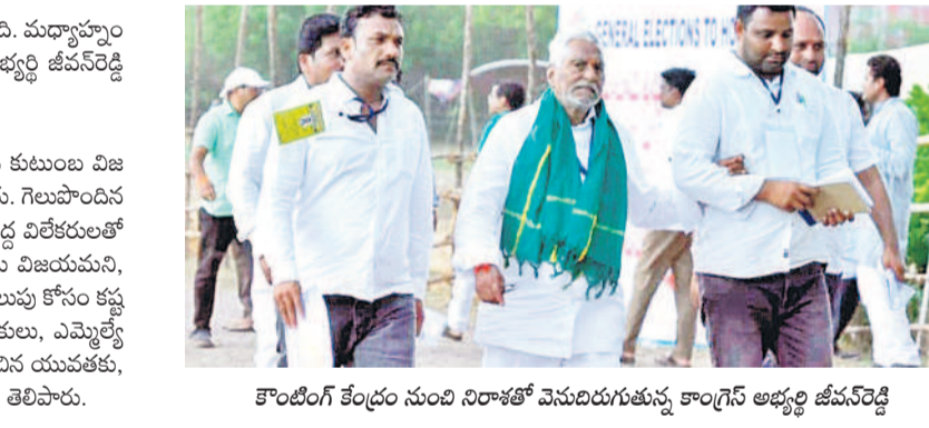
కొంటింగ్ కేంద్రం నుంచి నిరాశతో వెనుదిరుగుతున్న కాంగ్రెస్ అధ్యక్షులు