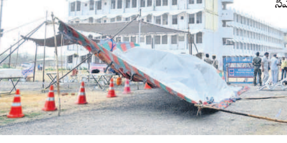
సీఎస్ఎల్ వద్ద పడిపోయిన టెంట్లు

కొంటింగ్ కేంద్రం వద్ద.. డివీఎల్ మండల కేంద్రంలోని సీఎస్ఎల్ మంగళవారం పార్లమెంట్ ఎన్నికల కొంటింగ్ నిర్వహించిన విషయం విడితమే. కాగా మధ్యాహ్నం సమయంలో ఈశాంకం వల్ల భూభ్రంశం సృష్టించారు. సీఎస్ఎల్ వద్ద వేసిన టెంట్లు ఎగిరిపోయాయి. కొద్దిసేపు కాలువలు కలుపుకున్నాయి.