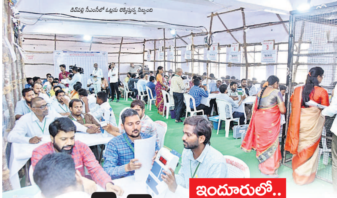
డివీఎల్ సీఎస్ఎల్ ఓట్లను లెక్కిస్తున్న నిబంధి