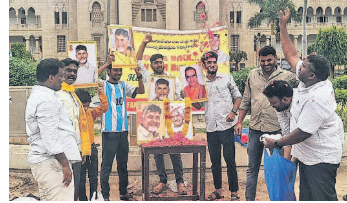
ఆర్ట్స్ట్ కళాశాల ఆవరణలో సంబురాలు జరుపుకుంటున్న విద్యార్థులు