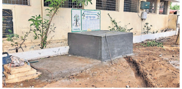
అడిక్మెట్ పాఠశాలలో ఏర్పాటు చేసిన నీటి కుశాయి

మండల పరిధిలోని 22 ప్రభుత్వ పాఠశా లలను అమ్మ ఆదర్శ పాఠశాలల కింద ఎంపిక చేశారు. ఐదు ఉన్నత పాఠశాలలు, 17 ప్రాథ మిక పాఠశాలల్లో విద్యార్థులు, అధ్యాపకులకు ಮರುಗ್ಷನ ಸೌಕರ್ಗ್ಯಾಲ್ ಕಲ್ಪಿಂಕಡಾನಿಕಿ ప్రభుత్వం రూ. 1.6 కోట్ల నిధులు కేటాయిం చింది. ఇందులో భాగంగా తొలుత ఒక్కో లం పరిధిలోని ఎంపిక చేసిన పాఠశాలల్లో 🏻 పాఠశాలకు రూ రూ.40 వేల చొప్పున విడు