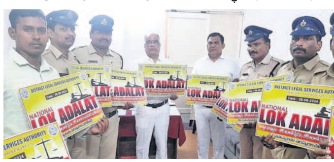
కుషాయిగూడ జిల్లా కోర్టు ఆవరణలో జాతీయ లోక్ అదాలత్ పోస్టర్న్ ఆవిష్కరిస్తున్న జిల్లా ప్రధాన న్యాయమూర్తి, న్యాయ సేవాధికార సంస్థ చైర్మన్ బాల భాస్కర్

జిల్లా ప్రధాన న్యాయమూర్తి, న్యాయ సేవాభికార సంస్థ చైర్త్షన్ బాల భాస్కర్