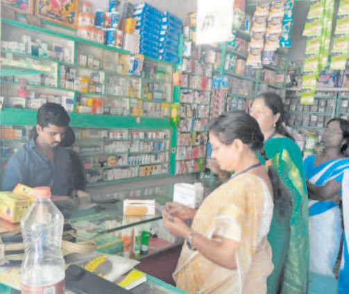
వర్షంలోని ఓ మెడికల్ షాపులో తనిఖీలు చేస్తున్న వైద్యులందరూ