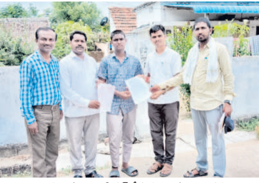
విద్యార్థుల నుంచి అధ్యక్ష తీసుకుంటున్న అధ్యాపకులు