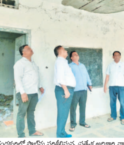
కందకుర్తిలో స్థానిక పరిశోధన ప్రత్యేక అధికారి వాణిజ్యపర్యటన (ఫైల్)

రెంజల్, జూన్ 4: ప్రభుత్వం సౌకర్యాల కల్పించేందుకు ఎంపిక చేసిన అమ్మ ఆదర్శ పాఠశాలపై పాలకులు, అధికారులు నిర్లక్ష్యం వహిస్తున్నారు. ఈ పాఠశాలలో చేపట్టాల్సిన మరమ్మతులు నష్టపడకనే సాగుతున్నాయి. వేసవి సెలవులు ముగిసినా పనులు పూర్తయ్యాయి లేదానే విద్యార్థుల తల్లిదండ్రులు ఆందోళన చెందుతున్నారు. అమ్మ ఆదర్శ పాఠశాల కింద రెంజల్ మండలంలోని 18 జిల్లా పరిషత్ ఉన్నత, ప్రాథమిక, ప్రాథమికోన్నత పాఠశాలలను రాష్ట్ర ప్రభుత్వం ఏటిల్లో ఎంపిక చేసింది. ఎంపిక చేసిన పాఠశాలల్లో గదులు మైనర్, మేజర్ రివీల్ పనులను గడుపుతోగా చేపట్టేందుకు రూ. 74 లక్షల 10 వేల మంజూరయ్యాయి. ఈ పనులకు ముందుగా 10 శాతం నిధులను హాచ్ ఎం, ఎన్ఎంసీ వైద్యులతో జాయింట్ బ్యాంక్ ఖాతాలో జమ చేశారు. మరమ్మతు పనుల పర్యవేక్షణ బాధ్యతను హాచ్ ఎం, ఎన్ఎంసీ వైద్యులకు ప్రభుత్వం అప్పగించింది. పాఠశాలలో అవసరమైన మరమ్మతులు, బాలురు, బాలికలకు వేర్వేరుగా మరు