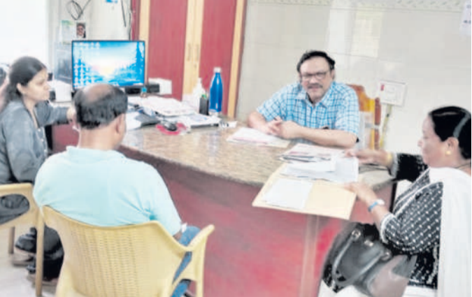
బోధన్ పట్టణంలో ఓ స్టానింగ్ సెంటర్లో రికార్డులను పరిశీలిస్తున్న వైద్యులందరూ