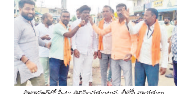
సాటాపూర్ లో స్వీట్లు తినిపించుకుంటున్న బీజేపీ నాయకులు