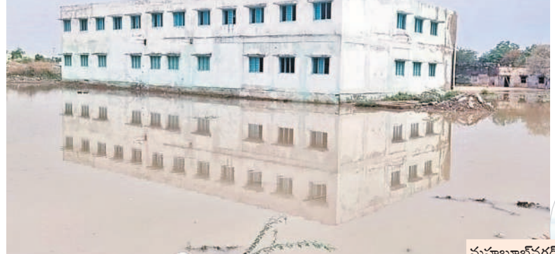
అలంపూర్ ప్రభుత్వ కళాశాల వెనుక భాగంలో బాటిగా నిలిచిన వర్షపు నీరు