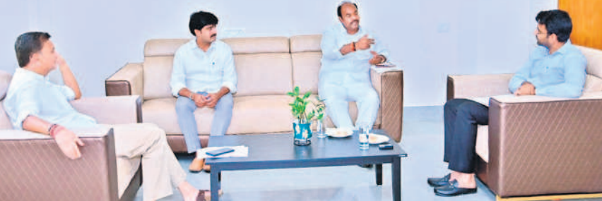
జోగుళాంబ గద్దాల కలెక్టర్ సంతోషితో మాట్లాడుతున్న ఎమ్మెల్యేలు బండ్ల, విజయదుర్గ, ఎమ్మెల్సీ చల్లా

• కలెక్టర్ కు విన్నవించిన గద్దాల, అలంపూర్ ఎమ్మెల్యేలు, ఎమ్మెల్సీ