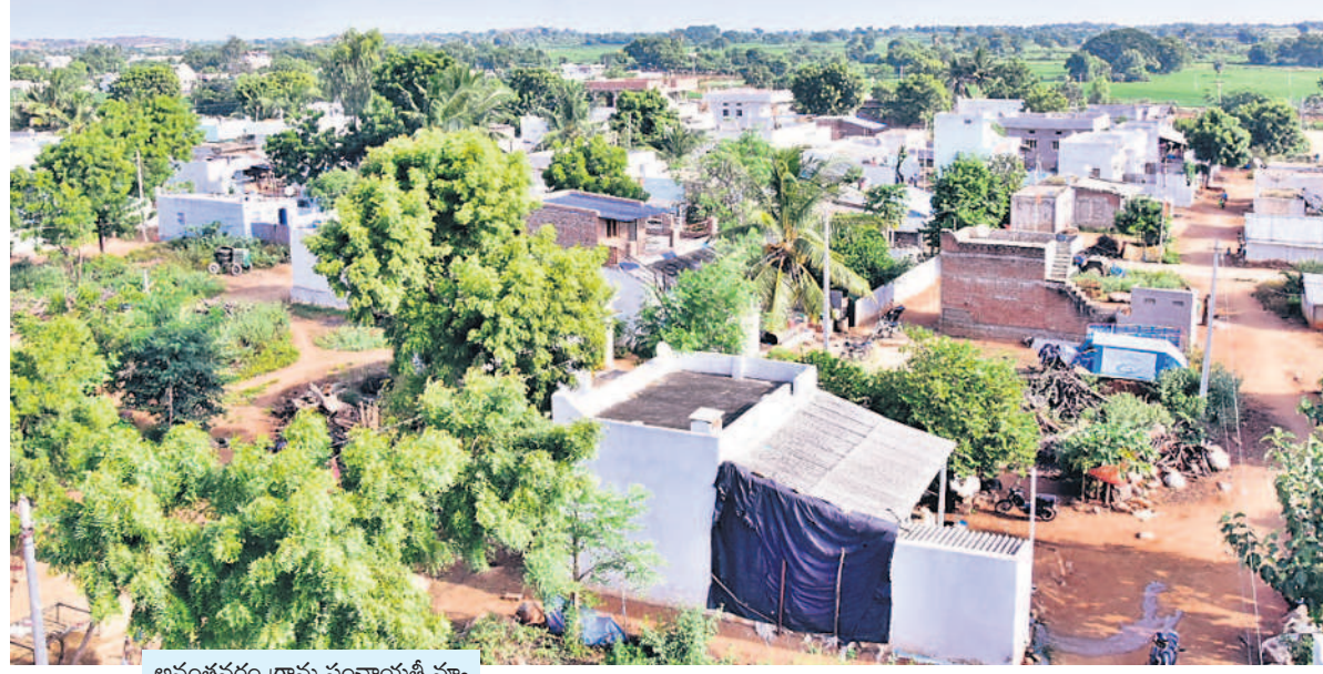
అనంతవరం గ్రామ పంచాయతీ వ్యూ