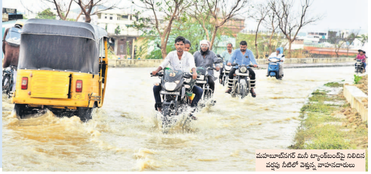
మహబూబ్ నగర్ మిసి ట్యాంక్ లోని నిలిచిన వర్షపు నీటిలో వెళ్తున్న వాహనదారులు