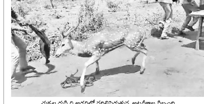
చుక్కల దుప్పి అడవిలో పదిలిపెడుతున్న అటవీశాఖ సిబ్బంది