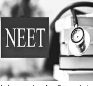
ఏకంగా 67 మందికి టాప్ ర్యాంకు వచ్చింది, వీరిలో ఆరుగురు బిజ్ ఎగ్జిక్యూటివ్స్

న్యూఢిల్లీ: వైద్య కోర్సుల్లో ప్రవేశాల కోసం నిర్వహించే నీట్ పరీక్షలో అక్షమాలమైన అభ్యర్థులను అక్షమాలమైన అభ్యర్థులు ఆరోపిస్తున్నారు. మళ్లీ పరీక్ష నిర్వహించాలని డిమాండ్ చేస్తున్నారు. రికార్డు స్థాయిలో