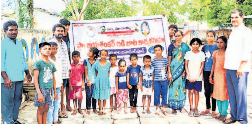
వికారాబాద్ : బడిబాట కార్యక్రమం రద్దీ నిర్వహిస్తున్న ఉపాధ్యాయులు, విద్యార్థులు

గ్రామాల్లో బడిబాట కార్యక్రమం బదుల్లో మౌలిక వసతుల కల్పన, నాణ్యమైన విద్యా బోధన విద్యార్థుల తల్లిదండ్రులకు అవగాహన కల్పిస్తున్న అధికారులు, ఉపాధ్యాయులు