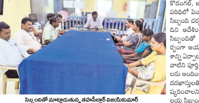
పెండింగ్ పనులను పూర్తి చేయాలి