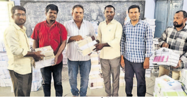
పాఠశాల సిబ్బందికి పాఠ్య పుస్తకాలను పంపిణీ చేస్తున్న మండల అంబిఎన్ కోల్లెజ్ లీడర్