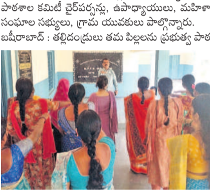
కులకర్ణ మండల రాంపూర్లో బడిబాట సందర్భంగా ప్రతిజ్ఞ చేయిస్తున్న ప్రధానోపాధ్యాయులు రాములు