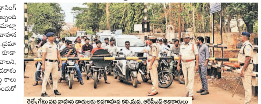
రైల్వే గేటు వద్ద వాహన దారులకు అవగాహన కల్పిస్తున్న ఆర్పీఎఫ్ అధికారులు