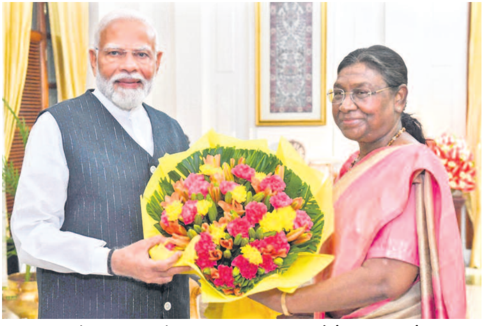
ఎన్డీయే పార్లమెంటులో పాల్గొని పాల్గొన్న అనంతరం గురువారం ఢిల్లీలోని రాష్ట్రపతి భవన్ లో రాష్ట్రపతి ద్రౌపది ముర్మును కలిసిన ప్రధాని నరేంద్ర మోదీ

శనివారం SATURDAY 8.6.2024 హైదరాబాద్ HYDERABAD పేజీలు: 12+4 Pages: 12+4 విదియ శనివారం, సూర్యోదయం: 5-41, సూర్యాస్తమయం: 6-49. శ్రీ క్రోధి నామ సంవత్సరం ఉత్తరాషాఢం గ్రీష్మ రుతువు జ్యేష్ఠ మాసం శుక్ల పక్షం తిథి: విదియ పగలు 8-55 వరకు. నక్షత్రం: ఆరుద్ర రాత్రి 7-42 వరకు. వర్షం: లేదు. రాహుకాలం: ఉదయం 8-58 నుంచి ఉదయం 10-38 వరకు. దుర్భుహార్యం: ఉదయం 5-41 నుంచి ఉదయం 7-26 వరకు. అమృతకాలం: ఉదయం 9-42 నుంచి ఉదయం 11-18 వరకు. PUBLISHED FROM HYDERABAD • KARIMNAGAR • WARANGAL • KHAMMAM • NALGONDA • MAHABUBNAGAR • NIZAMABAD www.ntnews.com ntdailyonline