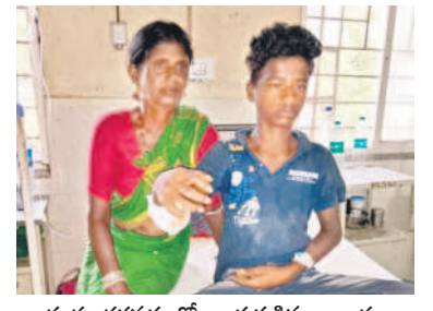
గుర్రం కరవడంతో గాయపడిన బాలుడు