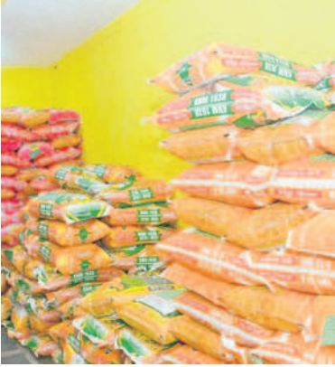
ప్రైవేట్ దుకాణాల్లో సిద్ధంగా ఉన్న ఎరువులు

మహబూబ్ నగర్, జూన్ 7 (నమస్తే తెలంగాణ ప్రతినిధి) : ఉమ్మడి పాలమూరు జిల్లాలో మూడు రోజులుగా వర్షాలు కురుస్తున్నాయి. అన్ని జిల్లాల్లో ఈదురుగాలులతో కూడిన వర్షం కురుస్తున్నది. వారం ముందుగానే నైరుతి రుతుపవనాలు పాలమూరును తాకడంతో అన్నదాతలు ఆనందంతో పొంగిపోతున్నారు. రికార్డు స్థాయి వేడిమిని తట్టుకోలేక విలవిల్లాడిన జనం వాతావరణం చల్లబడడంతో ఒక్కసారిగా ఉపశమనం పొందారు. మరోవైపు ఉమ్మడి జిల్లాలో ఈదురుగాలులు బీభత్సం సృష్టించాయి. వీటికి పడుగులు తోడ్పడే ఇప్పటివరకు 12 మంది ప్రాణాలు కోల్పోగా.. మూగజీ వాలు