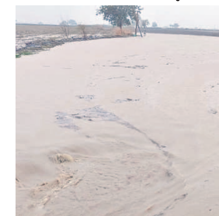
ఉండవెల్లి మండలం పుల్లూరు గ్రామ శివారులోని పంటపొలాల్లో నిలిచిన వర్షపు నీరు

ఉండవెల్లి, జూన్ 7 : మండలంలోని పుల్లూరు, అలంపూర్ చౌరస్తా, బొంకూరు ఉండవెల్లి, తళ్ళిశిల, భైరాపురం గ్రామాల్లో శుభవారం సాయంత్రం భారీ వర్షం కురిసింది. సాయంత్రం 5గంటలకు మొదలై రాత్రి 7 గంటల వరకు కురవడంతో వాగులు, వంకలు పొంగి పొర్లాయి. పుల్లూరు కమ్యూనిటీలోని ప్రధాన కాల్యువై వరద నాలుగు అడుగుల మేర ప్రవహించింది. దీంతో ఆయా కాలనిల ప్రజలు తీవ్ర ఇబ్బందులు ఎదుర్కొ