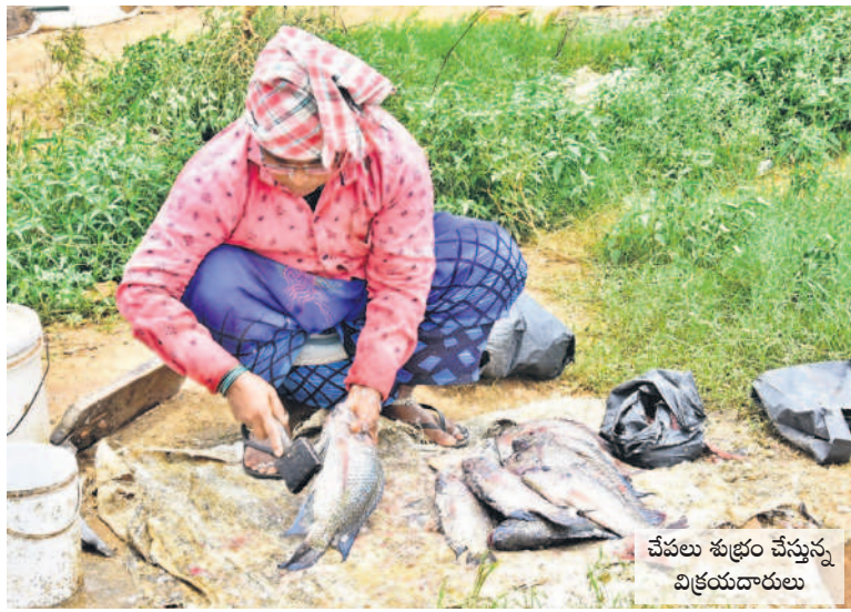
చేపలు శుభ్రం చేస్తున్న విక్రయదారులు