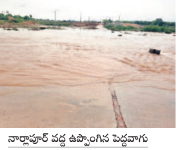
నార్కాపూర్ వద్ద ఉప్పొంగిన పెద్దవారు