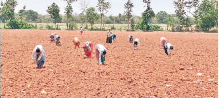
జడ్చర్ల మండలం కోట్లలో గ్రామ సమీపంలోని పొలాల్లో విత్తనాలు విత్తుతున్న రైతులు