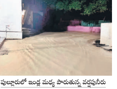
పుల్లూరులో ఇండ్ల మధ్య పారుతున్న వర్షపునీరు