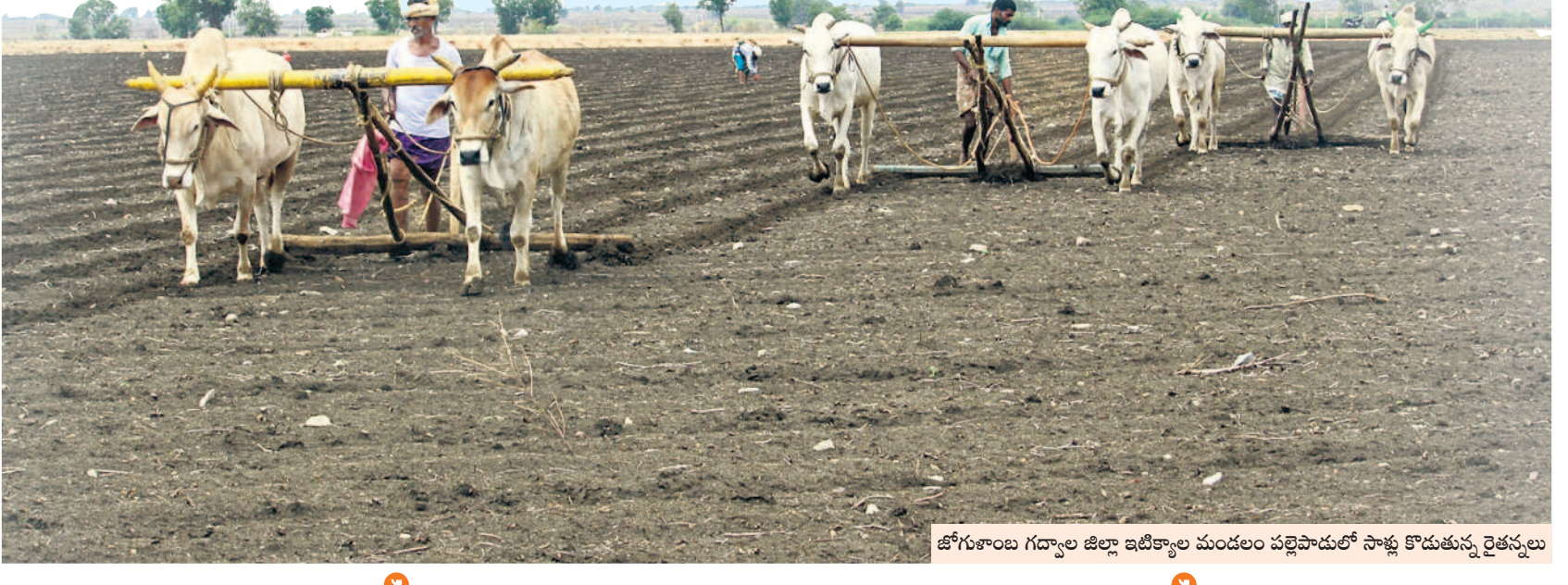
జోగుళాంబ గద్వాల జిల్లా ఇటీవల మండలం పల్లెపాడులో సాళ్లు కొడుతున్న రైతులను