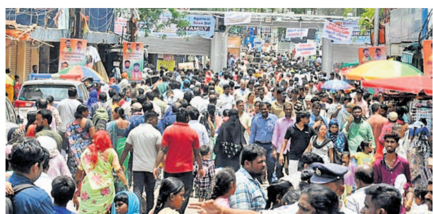
నాంపల్లి ఎన్నికల ప్రాంతం బయట కిక్కిరిసిన అస్తమా వ్యాధిగ్రస్తులు, వారి సహాయకులు