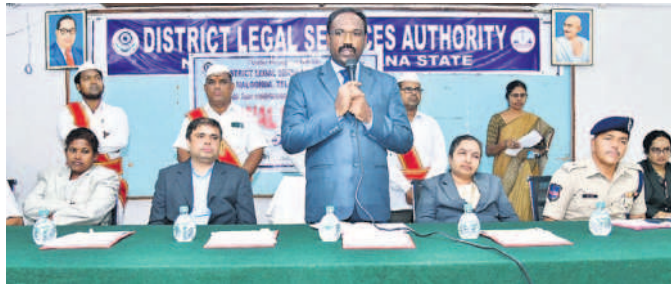
లోక్ అదాలత్లో మాట్లాడుతున్న జిల్లా కోర్టు ప్రధాన న్యాయమూర్తి నాగరాజు

జిల్లా కోర్టు ప్రధాన న్యాయమూర్తి నాగరాజు