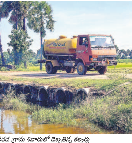
వరద గ్రామ శివారంలో దెబ్బతిన్న కల్వర్లు

కట్టంగూర్, జూన్ 8 : మండలంలోని వరద, మునుకుంట్ల గ్రామంలో నీటి ట్యాంకులు, కల్వ ర్లు శిథిలావస్థకు చేరడంతో ప్రజలు భయాం కు గురవుతున్నారు. ప్రస్తుతం వర్షాలు కురుస్తుండడంతో ఏ క్షణంలో కూలి మీద పడతా యోసిన ఆందోళన చెందుతున్నారు. కులితే ప్రమాదం మండలంలోని మునుకుంట్ల ప్రాథమిక పాఠ శాల సమీపంలో ఉన్న నీటి ట్యాంకు శిథిలావస్థకు చేరింది. ఏ క్షణంలోనైనా కూలిపోతున్నట్లుగా ఉన్నా పట్టించుకోవాలని వారు లేకుండా పోయారు. పాఠశాల సమీపంలో సుమారు 20 సంవత్సరాల క్రితం నిర్మించిన మినీ ట్యాంకు వద్దకు విద్యార్థులు వెళ్లి అడుకుంటుంటారు. ఆ సమయంలో ట్యాంకు కూలిపోతే ప్రమాదం జరిగే అవకాశాలు ఉన్నాయి. నీళ్ల దోహతు గురవుతున్నారు. ప్రస్తుతం వర్షాలు కురుస్తుండడంతో ఏ క్షణంలో కూలి మీద పడతా యోసిన ఆందోళన చెందుతున్నారు. కులితే ప్రమాదం మండలంలోని మునుకుంట్ల ప్రాథమిక పాఠ శాల సమీపంలో ఉన్న నీటి ట్యాంకు శిథిలావస్థకు చేరింది. ఏ క్షణంలోనైనా కూలిపోతున్నట్లుగా ఉన్నా పట్టించుకోవాలని వారు లేకుండా పోయారు. పాఠశాల సమీపంలో సుమారు 20 సంవత్సరాల క్రితం నిర్మించిన మినీ ట్యాంకు వద్దకు విద్యార్థులు వెళ్లి అడుకుంటుంటారు.