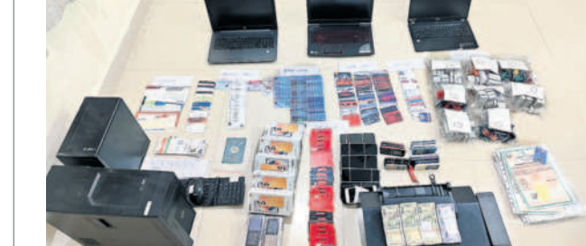
పోలీసులు స్వాధీనం చేసుకున్న నగదు, క్రెడిట్ కార్డులు