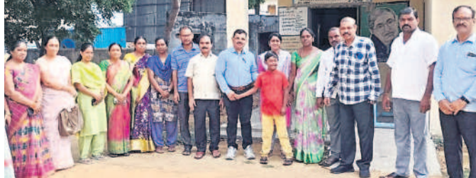
ప్రత్యేక అవసరాలుగల విద్యార్థులతో ఉపాధ్యాయులు

చిట్టాల, జూన్ 8 : స్థానిక భవిత కేంద్రంలో శనివారం ప్రత్యేక అవసరాలుగల విద్యార్థుల దినోత్సవాన్ని నిర్వహించారు. దివ్యాంగ విద్యార్థులను పాఠశాలల్లో చేర్చి చిట్టాల. ఈ సందర్భంగా ఎమ్మెల్యే తో సమన్వయం చేసిన ప్రత్యేక అవస