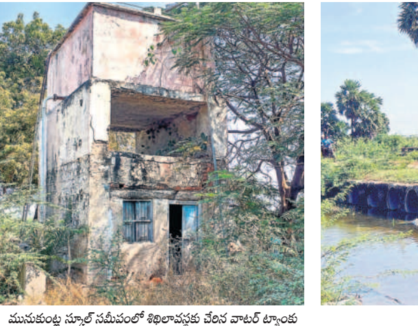
మునుకుంట్ల స్కూల్ సమీపంలో శిథిలావస్థకు చేరిన వాటర్ ట్యాంకు