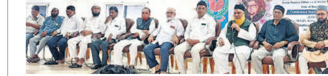
సదస్సులో పాల్గొన్న మైనార్టీ నాయకులు