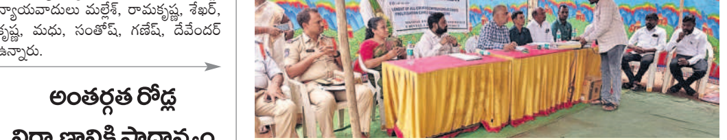
చేపల్లెఠాన్ : లోక్ అదాలత్లో సమస్యలను పరిష్కరిస్తున్న న్యాయమూర్తులు

జాతీయ న్యాయ సేవాధికారి సంస్థ అధికారం మేరకు లోక్ అదాలత్లు