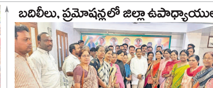
యాచారం : నందివనపల్లిలో బడిబాట కార్యక్రమాన్ని నిర్వహిస్తున్న ఉపాధ్యాయులు