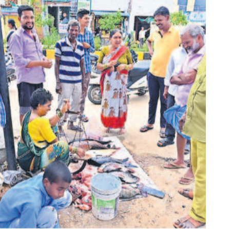
భూదాస్ పోచంపల్లిలో చేపల కొనుగోలు చేస్తున్న ప్రజలు

భూదాస్ పోచంపల్లి, జూన్ 8 : మృగశిర కార్తె ప్రవేశం సందర్భంగా శనివారం మార్కెట్లో హుంసపు ప్రయత్నంతో సందడి నెలకొంది. ఈ లోజు చేపలు తిండి ఆలోచనానికి చాలా మందిని, అప్రమాద వ్యాధి రాడనే నమ్మకంతో జనం ఎక్కువగా చేపల కొనుగోలు చేశారు. దాంతో షిప్ మార్కెట్లో కిక్కిరిసిపోతూ ఉంది. అయితే.. ఈ సారి చేపల ఉత్పత్తి తక్కువగా ఉండడంతో విక్రయదారులు ఎక్కువ ధరకు అమ్మకాలు చేపట్టారు. ప్రత్యేకంగా అక్కడక్కడ చేపల విక్రయ కేంద్రాలు ఏర్పాటు చేసి అమ్మకాలు జరిపారు. దీంతోపాటు చిత్తి, మలిన సెంటర్ల కూడా కోలాహలంగా కనిపించాయి.