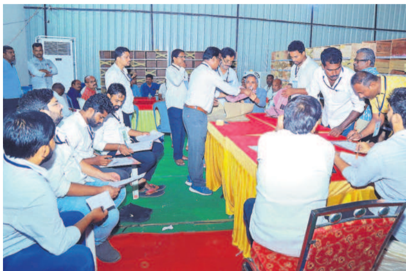
నల్లగొండలో ఎమ్మెల్యే ఓట్లను లెక్కిస్తున్న నిబ్బంది (ఫైల్)

నల్లగొండ ప్రతినది, జూన్ 8 (నమస్తే తెలంగాణ) : పట్టభద్రుల ఎమ్మెల్యే ఎన్నికల్లో చెల్లని ఓట్లు భారీగా ఉంటుండడం చర్చనీయాంశంగా మారింది. అభ్యర్థుల ప్రచారంలో, సోషల్ మీడియాలో, అధికారికంగానూ ఎంత అవగాహన కల్గిస్తున్నా దిగ్గిలు చేతబట్టి పట్టభద్రులు అసెంబ్లీకి ఓట్లు ఓటు వేయడంలో తడబాటుకు గురవుతూనే ఉన్నారు. ఈసారి కూడా చెల్లని ఓట్లు భారీగానే ఉండడం విస్తృతంగా గురిచేస్తున్నది. 2021 మార్చిలో జరిగిన ఎన్నికలతో పోలిస్తే ఈసారి అదనంగా 2.73శాతం చెల్లని ఓట్లు పోల్ కాపండ్ గమనార్హం. గత నెల 27న జరిగిన వరంగల్ - ఖమ్మం - నల్లగొండ పట్టభద్రుల శాసన మండలి ఉప ఎన్నికల పోలింగ్లో 4.83,839 మంది ఓటుపేజీలు గానూ 3,38,179 మంది ఓటు వేశారు. ఈ నెల 5 నుంచి మొదలైన కౌంటింగ్లో 6వ తేదీ సాయంత్రం తర్వాత తొలి ప్రాధాన్యత ఓట్ల లెక్కలు తెలిపిన ఓట్ల సంఖ్య తేలింది. పోల్ అయిన ఓట్లలో 8.27శాతం చెల్లని ఓట్లుగా చెట్టుబట్టల్లో పట్టణం. మొత్తం 27,990 మంది పట్టభద్రులు వేసిన మొదటి ప్రాధాన్యత ఓట్లు చెల్లకుండా పోయాయి. దాంతో చెల్లని ఓట్ల శుభ్రతారం దాఖలు చేయడంలో గెలుపొటములను ప్రభావింప చేయడంలో భాగమయ్యాయి. ఆసలే పోలింగ్ కేంద్రాలకు రాకుండా ఓటు వేయని వారిని పక్కన పెడితే వ్యయప్రయాసాలకు ఓర్చి క్యూలో బలబడి వేసిన వారి ఓటు కూడా చెల్లకుండా పోవడాన్ని ఎలా ఆర్ధం చేసుకోవాలన్న విషయాలపై వ్యక్తమవుతున్నాయి. కనీస అవగాహన లేకుండా ఓటు వేసి చెల్లకుండా చేసుకోవడం ఏమిటన్న చర్చ సాగుతున్నది.